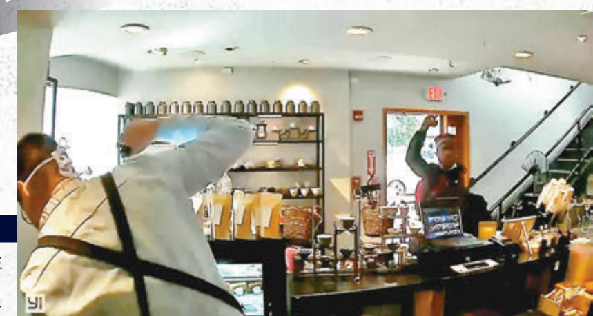
華盛頓 華裔茶店店主被噴椒。網上圖片

▲《紐約時報》刊登過去一年受襲的亞裔人士，包括手抱的2歲嬰兒、六旬老翁，涵蓋菲裔、韓裔、日裔等族裔，受害的有退休人士、體育記者、老師、退役空軍等，顯示歧視亞裔個案遍布全美，不分年齡、階層和社會背景。網上圖片