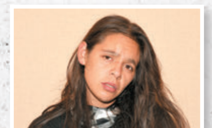
疑兇 | 蒙托亞