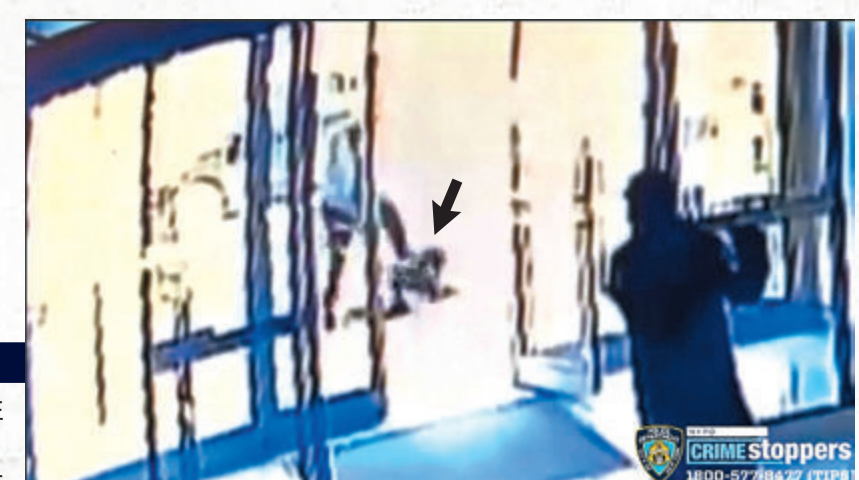
紐約 65歲嫗被狂徒狼踢。