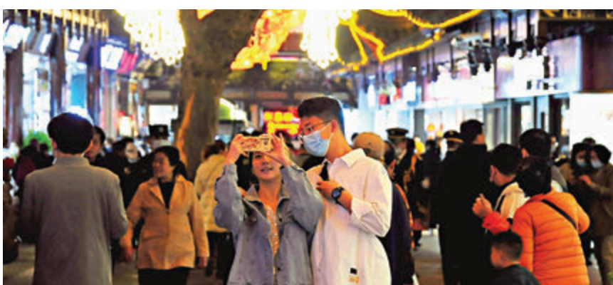
據上海文旅局統計，上海在清明連假共接待870.95萬人次的旅客。圖為3日晚間有遊客在上海知名景點豫園內拍照。

清明假期，北京是出遊最熱門城市之一。在三天內，北京累計接待遊客608.7萬人次，同比2020年增長4倍，