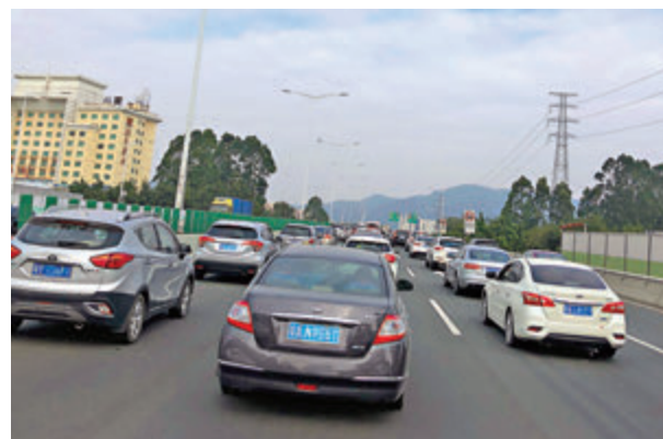
在清明假期最後一天，廣東高速公路返程車流逐步攀升。

同時，清明鐵路出行客流量亦火熱。廣鐵表示，探親流、返鄉流、祭祖流、踏青流相互疊加，僅清明假期首日廣鐵發客240萬人次，較2019年年增長4.6%，創歷年清明假期單日旅客發送量新高；而當天加開旅客列車282列，同比增長超1.7倍，創廣鐵今年以來運力投放新高。為應戰高峰客流，廣鐵從4月2日夜間起至假期末，在