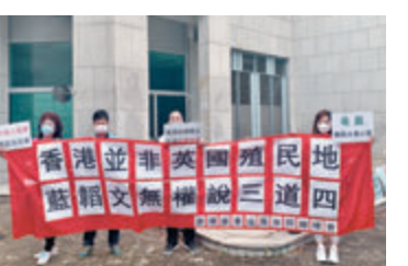
●香港廣東汕尾市同鄉總會表示，香港並非英國殖民地。