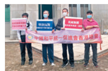
●中國和平統一促進會香港總會表示，堅決反對英國政府干涉中國內政。

香港文匯報訊（記者 子京）英美近日做出多項干涉中國內政的行為，引發香港市民強烈不滿。昨日多個團體及KOL分別前往英國、美國駐港總領事館門外請願，譴責英美對香港事務說三道四。