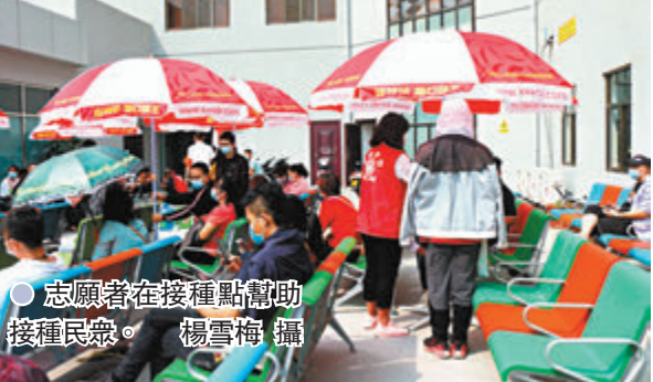
● 志願者在接種點幫助接種民眾。

疫情發生後，雲南省、德宏州和瑞麗市三級外事系統立即啟動應急預案，實施《緬語譯員調度方案》並啟用「緬語譯員調度中心」，通過原有120名骨幹譯員聯絡招募緬語翻譯志願者。