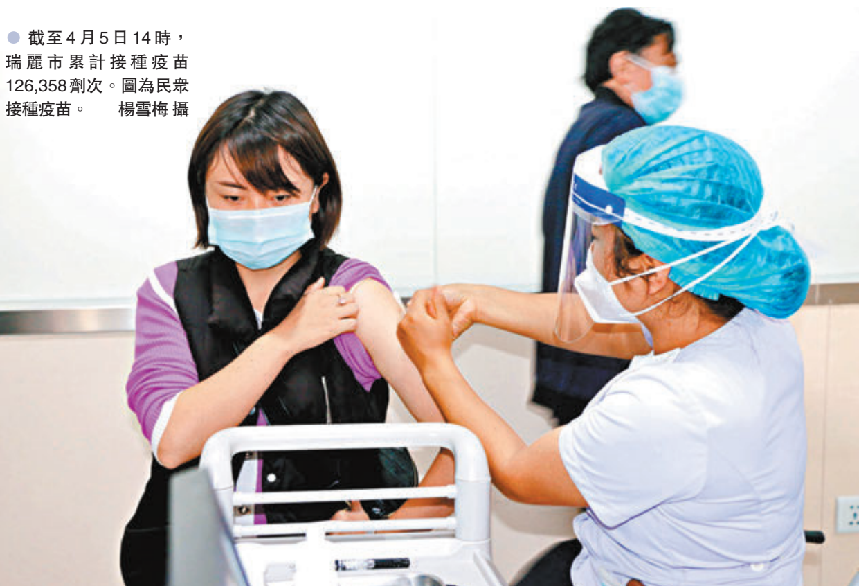
● 截至4月5日14時，瑞麗市累計接種疫苗126,358劑次。圖為民眾接種疫苗。