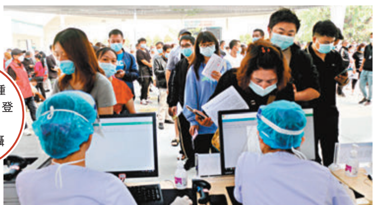
● 民眾接種前進行信息登記。

康希諾疫苗運抵德宏州 據環球網報道，據康希諾生物介紹，首輛滿載新冠疫苗的冷鏈車已於2日晚抵達昆明市應急倉庫，登記入庫後迅速轉往與瑞麗相鄰的德宏州隴川地區。此次運抵的新冠疫苗是康希諾生物與軍事科學院陳薇院士合作研發的重組新型冠状病毒疫苗(5型腺病毒載體)，該疫苗是中國目前4款獲批附條件上市的新疫苗中，唯一採用單針免疫程序的，在單針接種疫苗14天後，疫苗對所有症狀總體保護效力為68.83%。國內一名免疫學專家表示，單針疫苗接種起來程序簡單，可在同樣時間內接種更多人群，有利於用最短時間為盡可能多的人群提供保護，構建起免疫屏障。此外，該新冠疫苗的推薦接種年齡未設上限，可以為60歲以上人群接種。