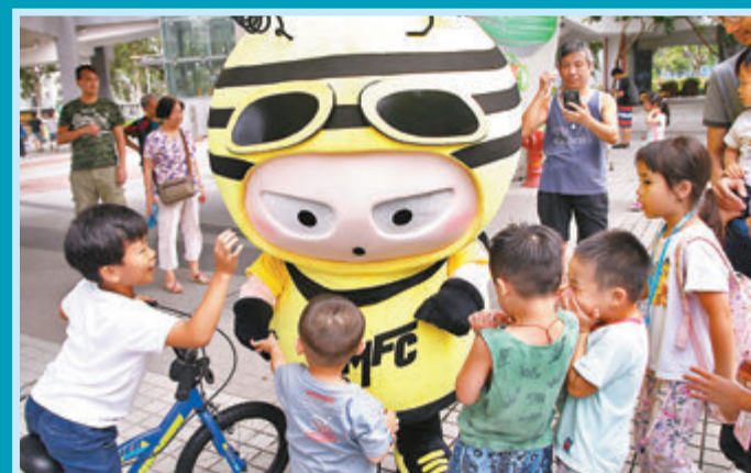
●吉祥物衝鋒Bee大受小朋友歡迎。

理文於2016年首次以冠名贊助形式亮相港超，當時是借用流浪會籍，以理文流浪名義參賽。2017年6月19日開始自立門戶，成為足總贊助會員，去年成為正式會員。2019年4月在菁英盃決賽打敗元朗，捧得球會史上首項錦標。上季與東方龍獅爭高級組銀牌冠軍，雖然最終落敗，但也刷新了球會最佳成績。聯賽季軍的身份也令這股球壇新勢力得以衝出香港，即將首次亮相亞洲足協盃，短短幾年已創立一個又一個里程碑。不過港府至今尚未就亞協盃外隊來港豁免限制一事表態，有可能令理文失去主場之利，會方表示仍要等待回覆。