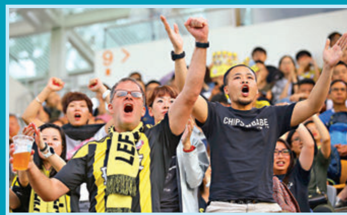
●理文球員來自世界各地，擁護亦一樣。

足總董事會仍未能就理文退賽之事結案，貝鈞奇稱董事會認為應對理文「從輕發落」。同時也沒交代會否處分愉園及天水圍飛馬，惟他一方面暗示不會罰款：「連保險費都交不出，還要罰10萬8萬，決定是否合適？」有網民不滿足總處事手法，發起網上聯署「杯葛菁英盃決賽」行動。