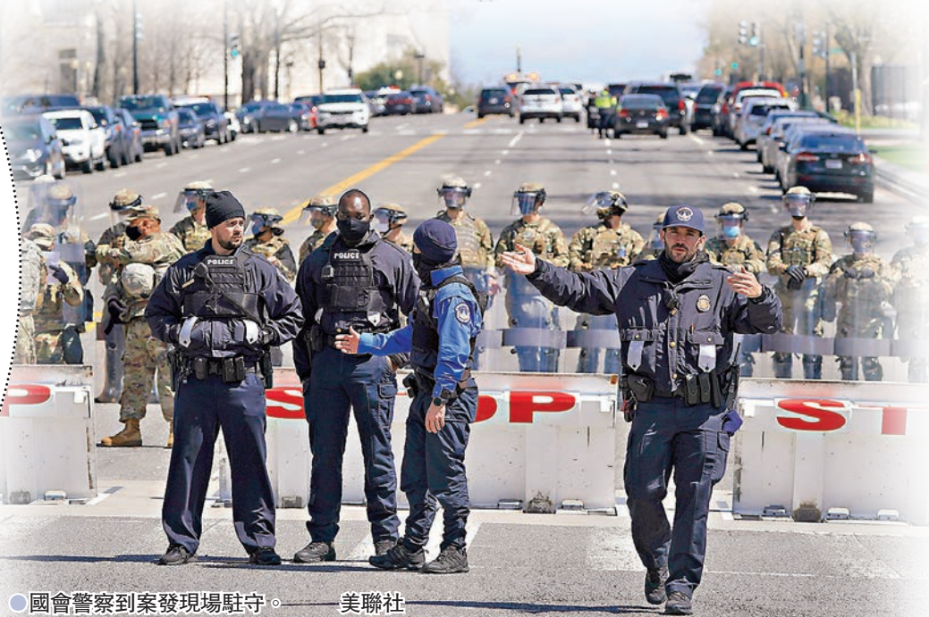
●國會警察到案發現場駐守。