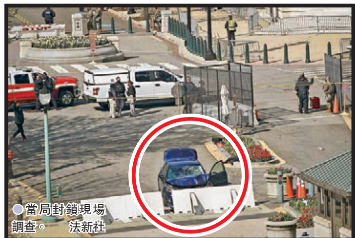
●當局封鎖現場調查。