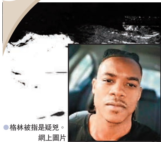
●格林被指是疑兇。網上圖片

美國國會山莊繼今年1月發生暴動後，前日再次遇襲，一名疑犯駕車撞向國會外的路障及國會警察，下車後揮刀施襲，造成兩名警員一死一傷，疑犯被在場其他警員擊斃。當局初步調查顯示事件不涉恐襲，亦與1月暴動沒有直接關係。總統拜登已下令白宮降半旗致哀，並向殉職警員家屬致以慰問。