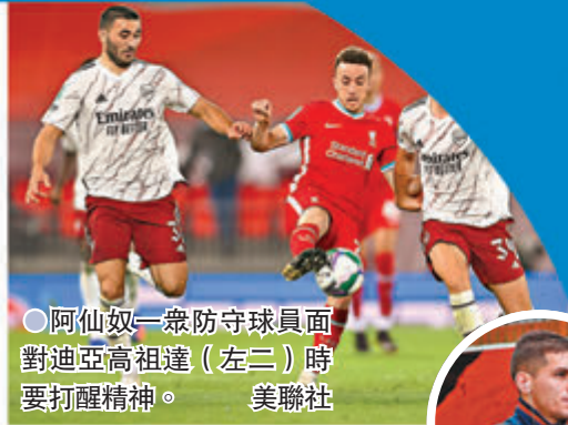
●阿仙奴一眾防守球員面對迪亞高祖達(左二)時要打起精神。

香港文匯報訊(記者 郭正謙)近8場英超只曾兩勝的利物浦本周將作客硬撼阿仙奴，兩隊仍有一絲爭奪前四的希望，今仗對雙方而言均是不容有失。利物浦防線的嚴重傷病問題仍未有解決辦法，幸好葡萄牙前鋒迪亞高祖達復出後狀態不俗，將是「紅軍」爭取3分的最大武器。(now611及621台周日3:00a.m.直播)