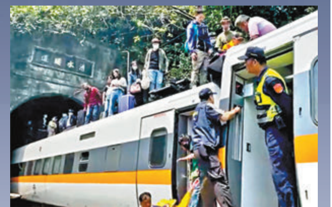
● 乘客逃出事故現場。

另據中通社報道，台灣陸委會2日回應表示，對於中國大陸各界人士對2日台鐵北迴線重大意外事故的慰問與關懷，表達感謝之意，並指除了一名陸生受到輕微皮肉擦傷已出院離外，並無其他陸籍人士傷亡訊息。