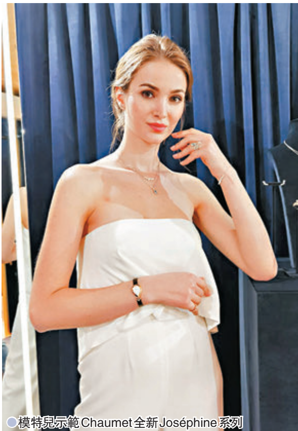
●模特兒示範 Chaumet 全新 Joséphine 系列

踏入春天，時裝界紛紛推出各款春季服飾，同時在珠寶及腕錶品牌方面，亦推出一系列品牌特有的主題及復刻款式，以品牌悠久歷史元素為特色，讓大家可以自由配搭，給平平無奇的服裝添上色彩。今季，琳琅滿目的珠寶臻品與名錶，具收藏價值之餘，又可讓你打造獨一無二的優雅時尚風格。