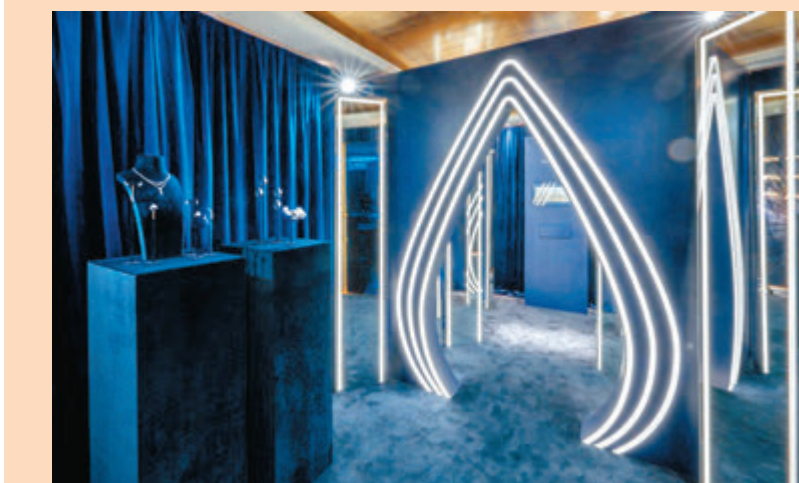
●Chaumet 早前假圓方專門店舉行的全新 Joséphine 系列新品預覽