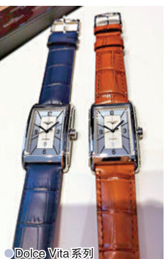
●Dolce Vita 系列

而 SILVER ARROW 重塑上世紀50年代的一枚經典腕錶型號，為其重新注入活力：不限年齡都放眼將來，就像不要局限研發賽車及超音速飛機的可能性，這種前瞻性精神啟發了「Silver Arrow」腕錶的誕生，成為品牌堅守傳統的系列之一。系列內藏獨有磁游絲自動上鏈機芯，提供長達5年的保修期服務。