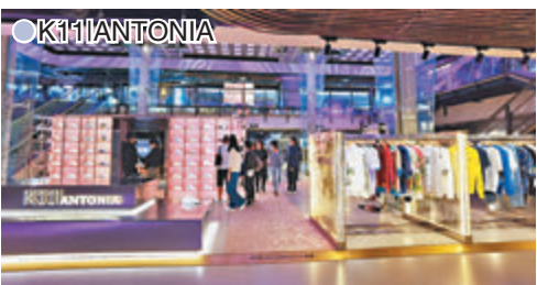
●K11 | ANTONIA

今個復活節，新鴻基地產(簡稱新地)旗艦商場 apm 特意為大家準備了豐富驚喜的一天遊行程，當中「快樂開箱」大型互動裝置，用長達20呎的貨櫃箱，加入藝術、科技及玩樂等元素，更築起15呎長櫻花大道，「櫻花迷」必定樂而忘返，為一天遊展開序幕！打卡呢 LIKE 樓，必定要品嚐以櫻花主題的「綻放櫻の味」人氣餐飲美食，滿足饞嘴一族，還可閒逛手作工藝市集及體驗可愛咖啡拉花工作坊等。