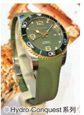
●Hydro Conquest 系列

錶，以及歌頌意大利的甜美生活與品味，錶面設計展現簡約風格，同時增添男士型號供選擇。