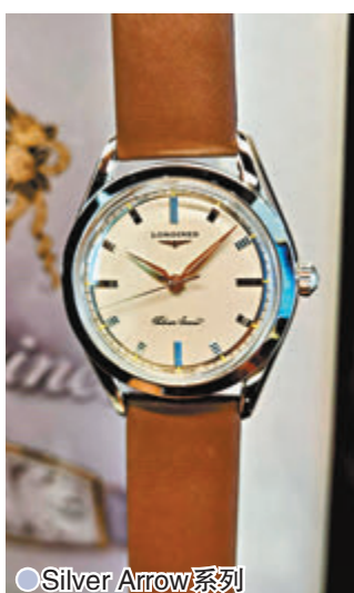
●Silver Arrow 系列