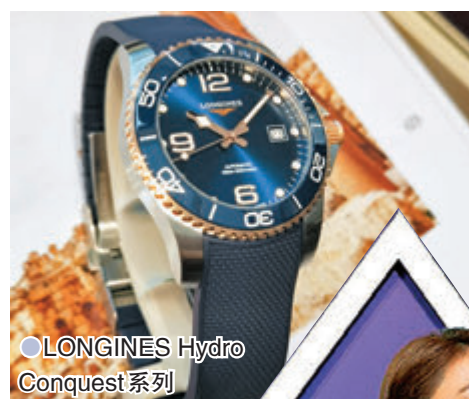
●LONGINES Hydro Conquest 系列