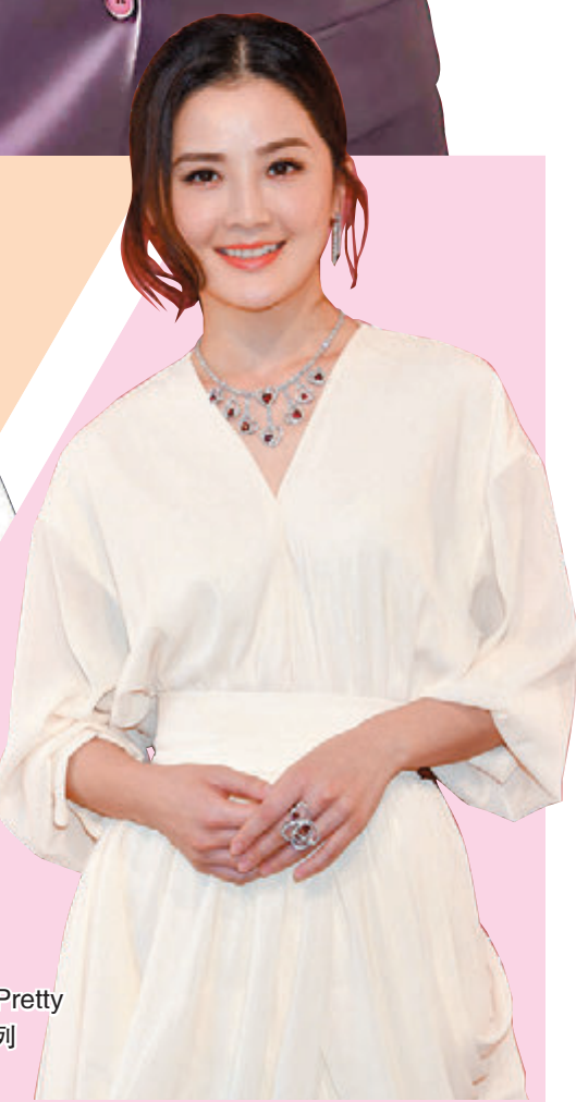
●蔡卓妍示範 Pretty Woman 珠寶系列