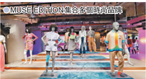
●MUSE EDITION 集合多個時尚品牌

香港文化零售地標 K11 MUSEA 的 MUSE EDITION 一直被視為城中潮流熱點，匯集世界各地潮流時尚品牌最新單品及新興設計師作品，將精彩的街頭文化帶入生活。今年春夏，MUSE EDITION 內的潮流品牌將推出一系列限量潮流單品，並將於4月3日周六的下午，以「FUTURE MUSES」為主題展現時尚街頭文化，在不同角落送上驚喜，帶來全新購物體驗。其集合多個時尚品牌如 K11 | ANTONIA、Off-White、Palm Angels、GCDS 等的2021街頭時裝，由本地各界代表展現「FUTURE MUSES」時尚街頭文化。