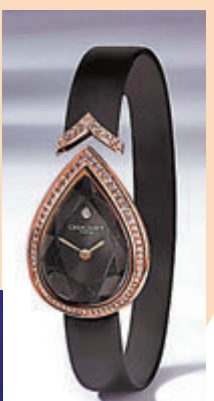
● Joséphine Aigrette 腕錶

延續品牌珠寶時計的先鋒藝術傳統，全新 Joséphine Aigrette 腕錶打破製錶規範，帶來一種嶄新的日常