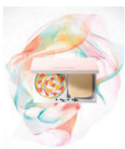
●彩虹夢幻底妝系列

擁有肌膚自然通透感，關鍵是控制肌膚色調的細微變化，POLA 希望人們能更享受化妝的時間，並充分利用自身肌膚的獨特性來表達自己，而不是下意識地掩蓋肌膚瑕疵。於是，品牌受「點彩繪畫效果」的概念所啟發，全新升級版「COLOR BLEND FOUNDATION 彩虹夢幻粉餅」及「PRIMER L 彩虹夢幻底霜」融合肌膚與生俱來的多彩色調，以全新光感效果塑造通透感，讓肌膚恍如從內透出自然細緻光澤。