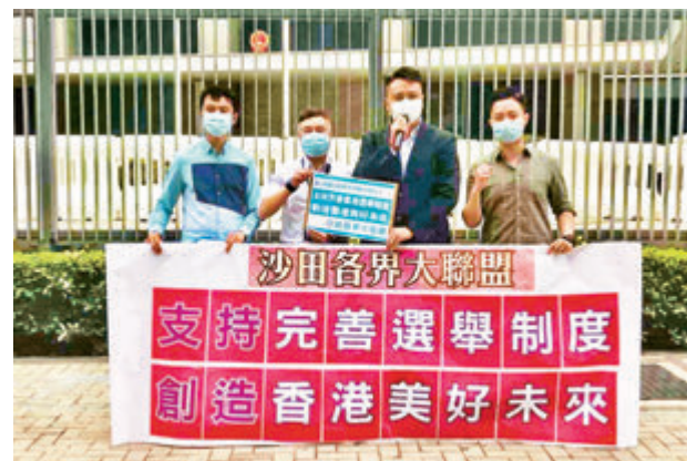
沙田各界大聯盟表示，支持全國人大常委會修訂基本法附件一和附件二，促請特區政府盡快展開本地立法。