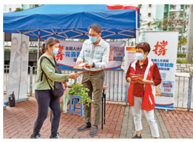
工聯會立法會議員陸頌雄(中)向街坊講解全國人大常委會關於完善香港選舉制度的決定。