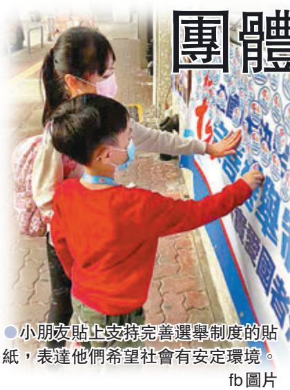
小朋友貼上支持完善選舉制度的貼紙，表達他們希望社會有安定環境。 fb 圖片