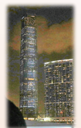
在西九國際貿易中心外牆有「完善選舉制度」大螢幕走字。