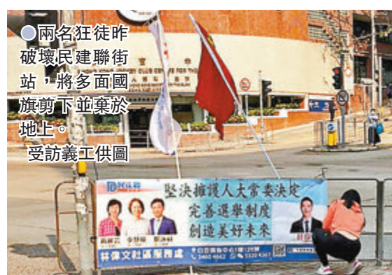
兩名狂徒昨破壞民建聯街站，將多面國旗剪下並棄於地上。

及地區聲稱特區政府及警察的行為是在「打壓異見」。郭蔭庶回應說，相關捕行動是有必要的，因為香港正面對迫切的國家安全威脅，包括來自美國政府的威脅。被問及美國早前「制裁」內地及香港多名官員，郭蔭庶認為美國的意圖明顯是想壓制中國發展，並形容這個是公開的秘密，又說地球上有些國家從骨子裡就有侵略性。