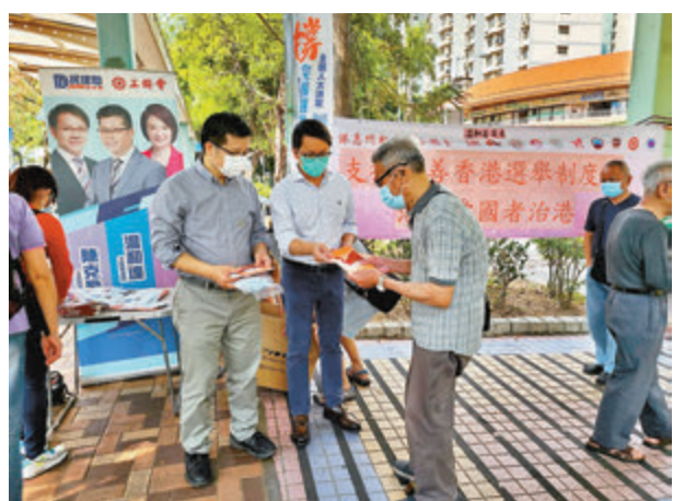
民建聯立法會議員陳克勤(中)向市民宣傳完善選舉制度。