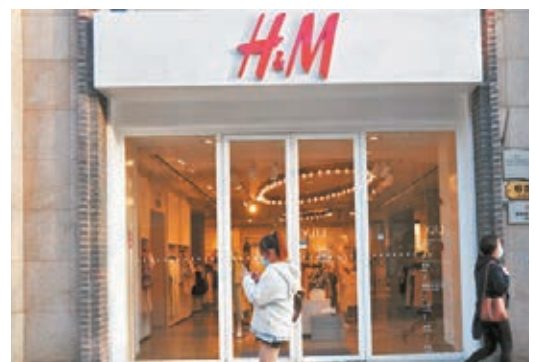
●上海黃浦區一家H&M門市，店內顧客人數不多。