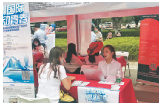
●不少港澳企業招聘大學生，開拓大灣區市場。

「我們宿舍6人，已經獲得offer的共3人，還是挺緊迫的。之前我傾向於在媒體工作，但現在也開始關注人力資源、廣告、策劃之類的崗位