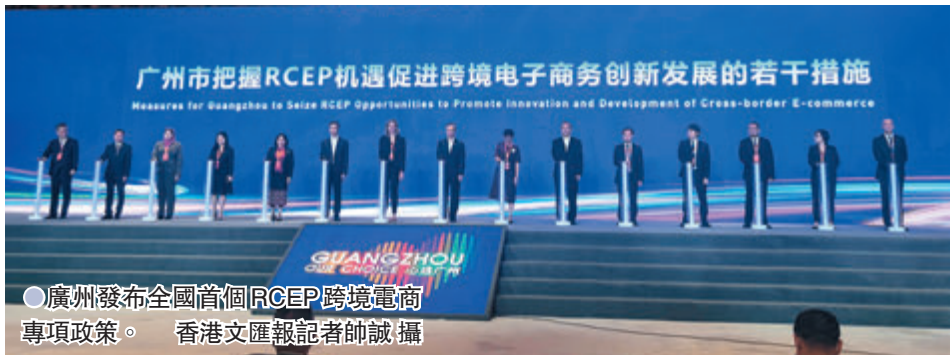
●廣州發布全國首個RCEP跨境電商專項政策。

香港文匯報訊（記者 帥誠 廣州報道）3月30日，2021第七屆中國廣州國際投資年會開幕，來自35個國家的嘉賓及企業出席，會上廣州正式發布了全國首個RCEP跨境電商專項政策《廣州市把握RCEP機遇促進跨境電子商務創新發展的若干措施》（下稱《若干措施》），提出RCEP國家跨境電商貨物24小時內放行，易腐貨物爭取6小時內放行；支持企業加快發展面向RCEP市場的跨境電商出口海外倉業務，為員工開展跨境電子商務專業培訓的企業給予資金補貼等措施。