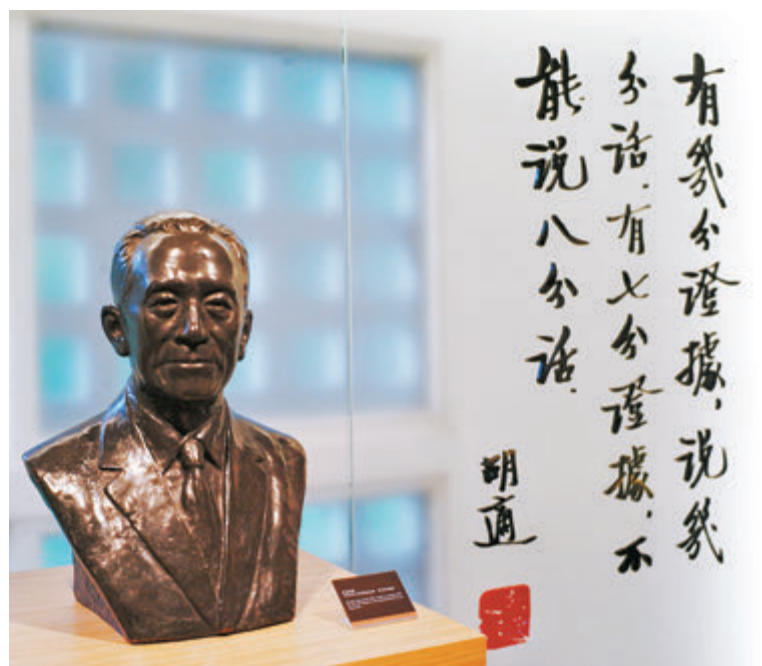
● 胡適是中國近代著名學者。