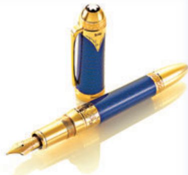
● 這支筆用什麼材料來做，普通話不宜說「是……來的」。 資料圖片

說到判斷句，我們順帶提一提與判斷句有關的語氣詞。粵語表示判斷的語氣詞有「咁嘅」、「之嘛」和「囉」等，如：「本來係咁嘅」、「佢做嘢只不過係慢啲之嘛」和「你要走咁走囉」。如果用普通話說的話，就要用「這樣的」、「罷了」和「唄」來表達，可以