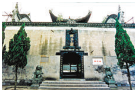
● 永州紀念柳宗元的柳子廟。 資料圖片

柳宗元慶賀小丘終能得到賞識，發揮自己的魅力。當中也蘊含對自己懷才不遇的憤慨。茅坤《唐宋八大家文鈔》：「予按子厚所謫永州、柳州，大較五嶺以南，多名山峭壁、清泉怪石，而子厚以文章之雋傑客茲土者久之。愚竊謂公與山川兩相遭，非子厚之困且久，不能以搜岩穴之奇；非岩穴之怪且幽，以無以發子厚之