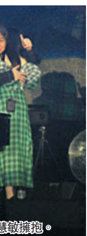
●伍仲衡與周慧敏擁抱。