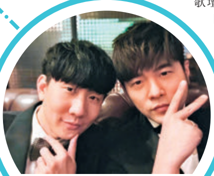
●林俊傑(左)與周杰倫齊穿西裝仔骨骨。

香港文匯報訊(記者 依江)大前日歌壇天王林俊傑(JJ)喜迎40歲生日，他於近日在社交媒體上載與周杰倫的合影，留言寫道：「很开心今年的生日有周杰伦可以陪我度過，而且是待到最後一刻!感動!」照片中，JJ手撫自己下巴，周杰伦則比Yeah，展現十足的好交情，難得的「雙J」合體亦讓網友超興奮。此前，林俊傑舉行線上直播慶生，周杰伦還錄VCR向對方催婚，不少粉絲留言稱相當期待兩位天王的音樂合作。