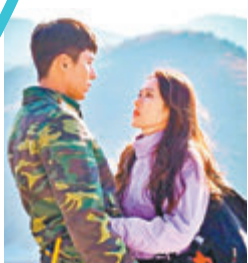
●玄彬與孫藝珍合演《愛的迫降》，並因而成為情侶。