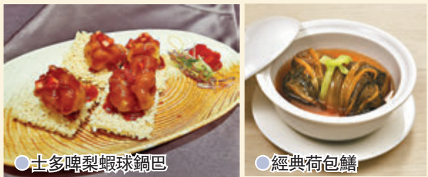
● 士多啤梨蝦球鍋巴