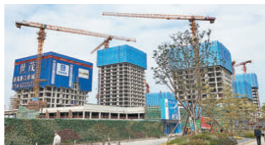
● 廣東擬三方面加深珠澳合作。圖為建設中的港珠澳口岸城項目。

《意見》還提出，打造「珠江口西岸綜合交通新樞紐」，包括規劃建設珠海至肇慶高鐵路、廣州至珠海（澳門）高鐵路、南沙至珠海（中山）城際鐵路，推動「澳珠極點」融入國家高鐵路網。此外，深入研究論證「深珠城際鐵路」（伶仃洋通道），跨珠江口貫通深圳珠海兩市，並謀劃延伸至陽江，構建珠江口西岸沿海鐵路通道。