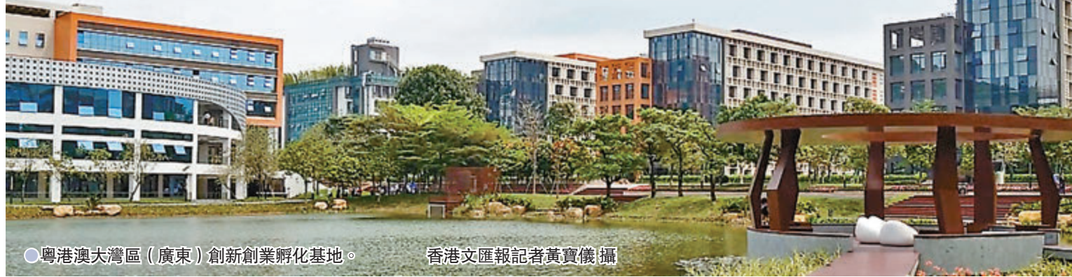
● 粵港澳大灣區（廣東）創新創業孵化基地。