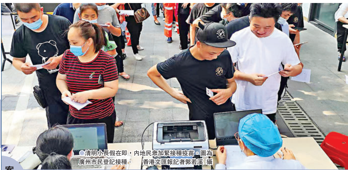
清明小長假在即，內地民眾加緊接種疫苗。圖為廣州市民登記接種。