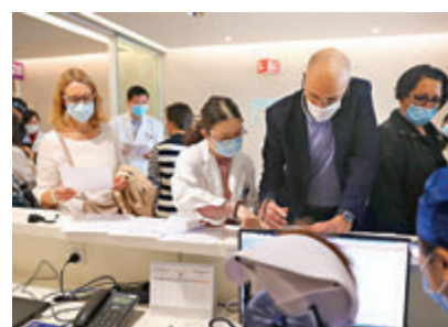
●上海全面啟動在滬外籍人士新冠病毒疫苗預約接種。

疫苗，全程需接種兩劑。已參加上海市社會保障醫療保險的外籍人士，享受與其他參保中國公民同等待遇。未參保的外籍人士，自費接種疫苗，費用為每劑100元人民幣。