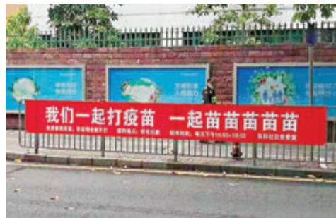
●火上熱搜的深圳鹽田區接種疫苗標語。

據深圳市衛健委透露，全市開展新冠疫苗全員接種，深圳市屬醫院也作出積極響應，迅速組建了4,500多名市級支援醫療隊，根據各區新冠病毒疫苗接種的醫療保障需求，分期分批支援各區開展新冠病毒疫苗接種工作。