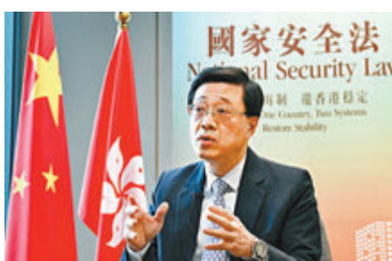
●保安局局長李家超。資料圖片

他指出，在囚者可經多個渠道作出申訴，包括向法院、到院所巡視的懲教署總部首長級人員，或懲教署投訴調