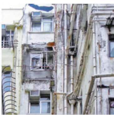
●申訴專員公署公布政府對私人樓宇污水渠錯誤接駁至雨水收集系統問題的處理主動調查結果。

香港文匯報訊（記者 文森）私人樓宇污水渠錯誤接駁至雨水收集系統，會造成海洋近岸污染。申訴專員公署的調查發現，屋宇署有嚴重延誤處理「駁錯渠」個案的情況，有個案更超逾11年仍未獲解決，原因是署方的監察機制未能發揮預期效用，未有及早展開調查，未有妥善分配人手和未有果斷執法，更沒有主動向「三無大廈」提供協助。