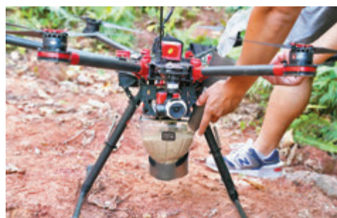
●土力工程處近日開始試用無人駕駛飛行系統播種修復曾發生過山泥傾瀉山坡的植被。土力工程處提供

工復修雖然可以直接種下樹苗，減省等待種子發芽生長的時間，但事前需要搭建工作台及通道等，費用最少數十萬元，工程所需時間亦較長。