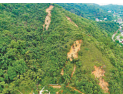
●近粉錦公路的天然山坡是其中一個試用無人機系統播種修復植被的地點。

土力工程處處長（斜坡安全）陳惠蓮表示，用無人機為一個面積約100平方米的山泥傾瀉殘留播種只需一日，成本約一兩萬元。相比之下以人