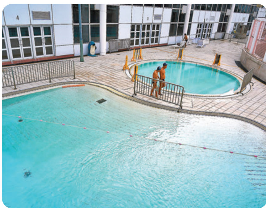
●政府宣布本周四起放寬部分社交距離措施，包括可在遵守一系列感染控制措施後重開公眾泳灘、泳池及私人泳池。圖為九龍公園泳池。

陳肇始昨日會見傳媒時指出，過去一星期本港的疫情逐漸緩和，本地個案平均每日少於5宗，源頭不明個案平均每日約一兩宗，雖然過去一個月曾出現食肆及健身中心的群組爆發，但成功於短時間內遏制疫情蔓延，亦顯示政府在第四波疫情期間推行的多項新措施對遏制整個疫情和個別群組爆發發揮了一定功效。