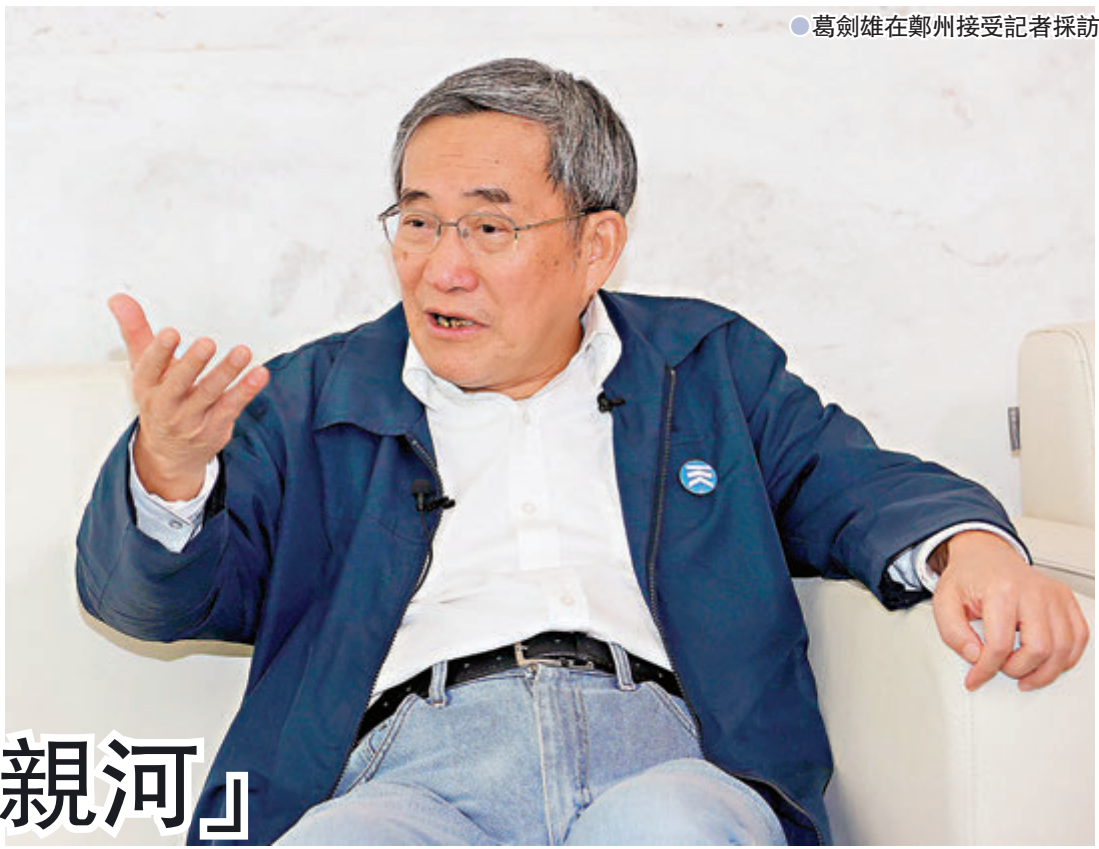
● 葛劍雄在鄭州接受記者採訪

日前，「天一文化講壇」邀請到復旦大學資深教授葛劍雄來鄭州做主題分享，帶領大家「沿黃河探尋文明的歷史」。葛劍雄通過實地考察，新撰寫《黃河與中華文明》一書，揭開黃河不為大眾所知的來龍去脈。從1990年他寫《滔滔黃河》，逾30年過去了，葛劍雄對黃河有了哪些新的認識和看法呢？ 文：香港文匯報記者 劉蕊