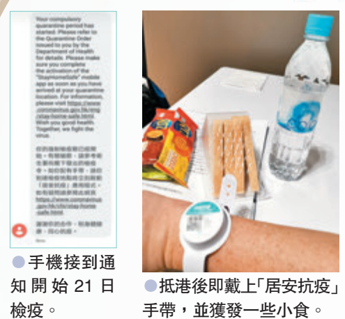
抵港後即戴上「居安抗疫」手帶，並獲發一些小食。