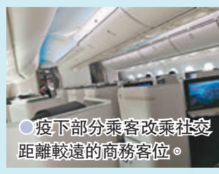
疫下部分乘客改乘社交距離較遠的商務客位。