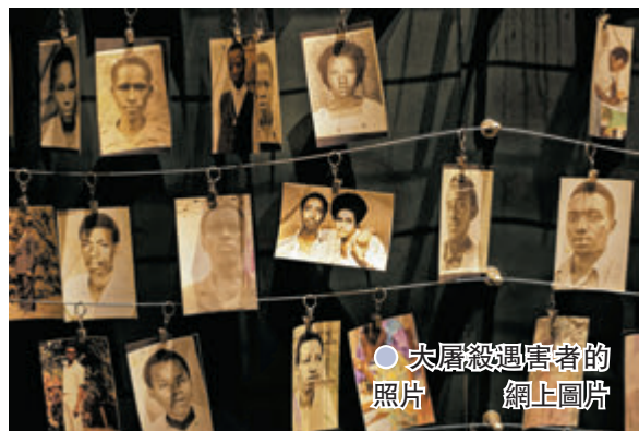
● 大屠殺受害者的照片

1994年4月6日，非洲國家盧旺達兩大部族圖西族與胡圖族爆發持續百日的大規模暴力衝突，導致近80萬圖西族人死亡，事件被稱為「盧旺達大屠殺」。相隔27年後，由法國多位歷史學家組成的專家委員會日前發表大屠殺調查報告，明確指出大屠殺源於法國時任總統密特朗及其親信「盲目的意識形態」引導下執行的盧旺達政策，認為法國對醞釀中的大屠殺「視而不見」，對事件負有「沉重和無法推卸的責任」。