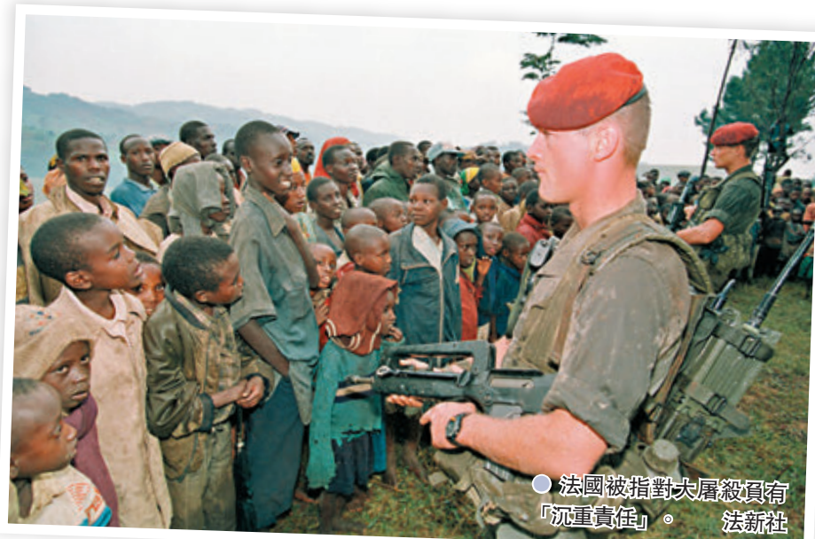
● 法國被指對大屠殺負有「沉重責任」。