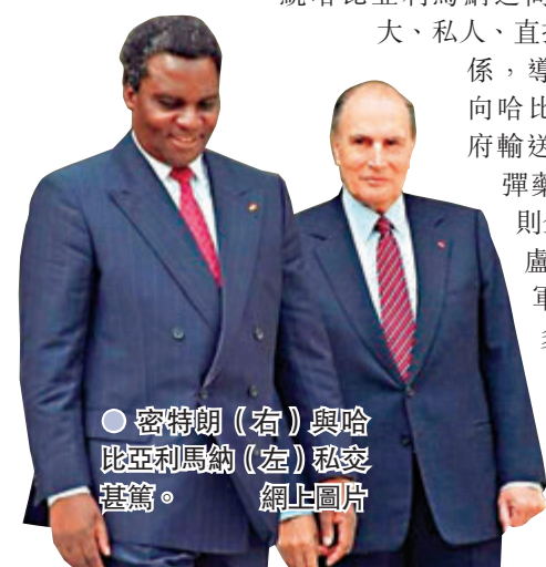
● 密特朗(右)與哈比亞利馬納(左)私交甚篤。

報告指出，當年法國之所以站在胡圖族獨裁者一方，「完全出於密特朗的意志」，強調密特朗與時任盧旺達胡圖族總統哈比亞利馬納之間，存在「強大、私人、直接」的私人關係，導致法國政府向哈比亞利馬納政府輸送大量武器和彈藥，法國軍方則全力以培培訓盧旺達政府軍，當收到眾多情報警告哈比亞利馬納政府的極端勢力可能導致種族大屠殺時，法國政府也置若罔聞。