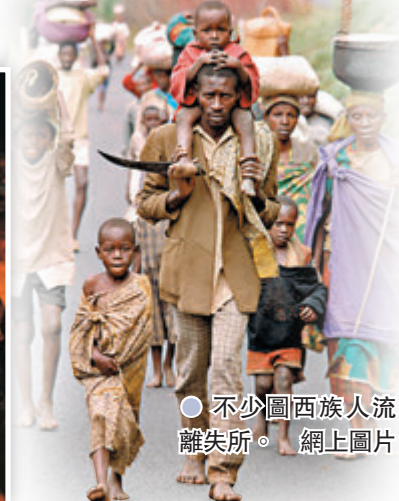
● 不少圖西族人流離失所。 網上圖片