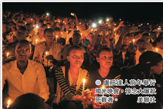
● 盧旺達人前年舉行燭光晚會，悼念大屠殺死難者。