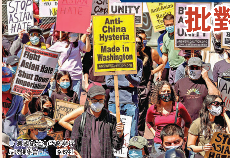
● 美國多城有亞裔舉行反歧視集會。 路透社

美國亞裔受歧視及仇恨問題近期引起關注，全美多地於周末再有民眾抗議，要求停止針對亞裔的暴力。遊行人士表示，美國政界對中國的外交政策，是造成反亞裔情緒愈來愈嚴重的原因，亦有非裔等其他族裔人士加入支持。全美由周五發起「全國行動及治癒日」，抗議針對亞裔的暴力，前日有約60個城市舉行示威，包括三藩市、洛杉磯、芝加哥、底特律、波特蘭等。在早前6名亞裔女性被槍殺的亞特蘭大，有人舉起「停止妖魔化中國和華人！」的標語，在華盛頓唐人街，亦有示威者在橫幅寫下「我不是病毒，也不是敵人，我是華裔美國人，我愛我的身份」。示威大致和平，在洛杉磯韓國城，有老人院長者推着助行器參加，亦有父母帶著年幼孩童遊行。