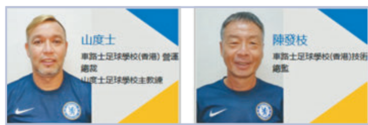
●山度士和陳發枝皆成功轉型。官方截圖

「香港足球先生」自1977至78球季創立，過去42屆共誕生31位得獎者，撇除一些已離港的外援及轉趨低調的李威廉，包括離世的胡國雄在內的「足球先生」，退役後都不出做教練、從商或擔任足球評述員3條出路。