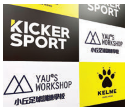
●贊助成「足球先生」主要收入來源。

互聯網興起後，YouTuber已成為一個職業，但不少人都對YouTuber的收入感到好奇。早前有成功人士出書，揭開全職YouTuber底牌，年薪甚至可達100萬港元。