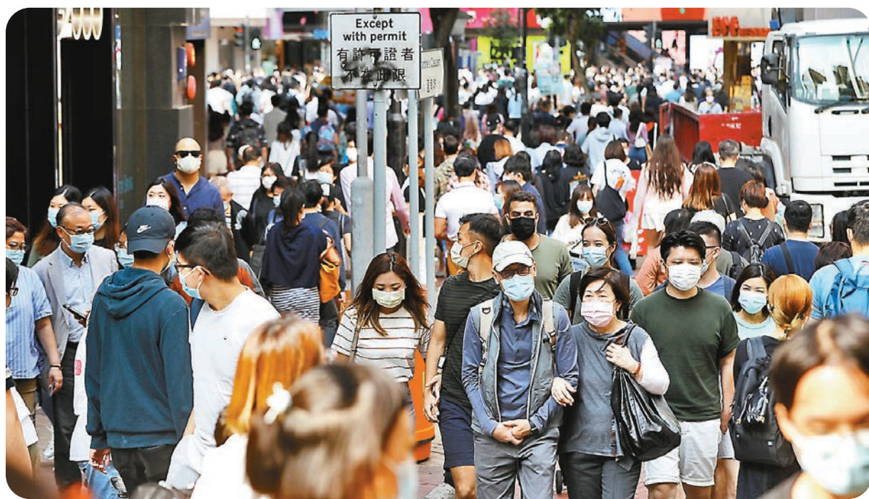
●香港昨日新增6宗新冠肺炎確診個案，全部為輸入個案，是自去年11月16日後首次本地「零感染」。

他強調，不戴口罩的場所最為危險，包括健身中心、食肆及酒吧等。市民在健身時即使有戴口罩，但涉及劇烈運動所呼出的微粒較多，故仍相當高危。最徹底防範疫情反彈的方法是市民盡快接種疫苗，「如果香港接種率低，其他國