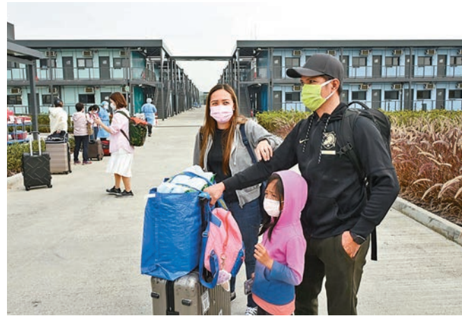
●完成檢疫的家庭，離開竹篙灣檢疫中心時表示滿意檢疫安排。