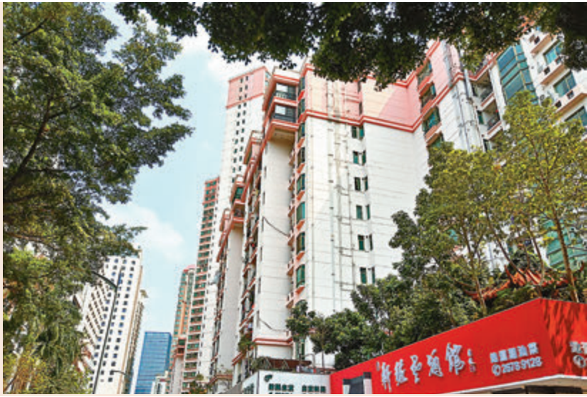
▶ 三部委昨發布通知，將聯合開展經營用途貸款違規流入房地產問題專項排查。資料圖片

香港文匯報訊 中國銀保監會、住房和中國央行三部委昨發布通知，為防止經營用途貸款違規流入房地產領域，不得向無實際經營的空殼企業發放經營用途貸款。要求各銀保監局、地方住建部門、央行分支要聯合開展經營用途貸款違規流入房地產問題專項排查，5月31日前完成，並加大對違規問題督促整改和處罰力度。