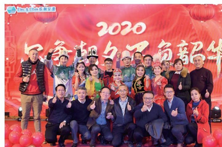
●建滔集團重視培養少數民族職工，促進民族團結，旗下的依利安達公司聘請大量少數民族員工，當中包括來自新疆維吾爾族的年輕人。