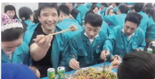
●少數民族的員工表示建滔集團像是一個大家庭，給了他們許多溫暖與關懷。

試，爭為先。「你知道什麼是中國貿易嗎？今天做中國貿易好像很容易，但在改革開放初期談何容易。」 他感慨萬千的說道，「當時，首要面臨的就是如何令廣大市民相信內地有發展機遇的問題，我還記得當時香港加工一條錶帶需要3塊錢，而內地只需要2塊即可全部做好，於是，在有了初步嘗試發現機遇後，便開始帶領技術人員去內地傳授技術經驗，如此一來，隨着越來越多的朋友投身內地發展，星星之火可以燎原，也便形成了如今我們看到的累累碩果。」 因此，他建議當今青年可以借鑑這些經驗，以海納百川的心態邁出了解的第一步。他表示，現在仍有許多香港青年未曾親眼看過內地城市，又談何愛國呢？讀萬卷書仍要行萬里路，帶領一批又一批的青年實地親身走訪仍長路漫漫，需不斷努力。同時，香港各中小學的愛國教育也應同步得到重視，