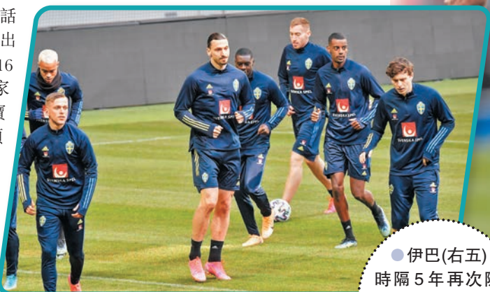
●伊巴(右五)時隔5年再次隨瑞典隊操練，迅即成為焦點。

同於B組的焦點戰，是西班牙主場對希臘(有線602及662台周五3:45a.m.直播)。西班牙在「黃金一代」淡出後，近年積極培養新血，今次入選的有3名新面孔，當中葡超士砵亨21歲右閘柏度樸路、巴塞隆拿18歲新星柏迪與伊巴的21歲前鋒拜恩基爾，都是主帥安歷基從U21(21歲以下國家隊)提拔上大國腳。「入選國家隊是我兒時夢想，」柏迪說：