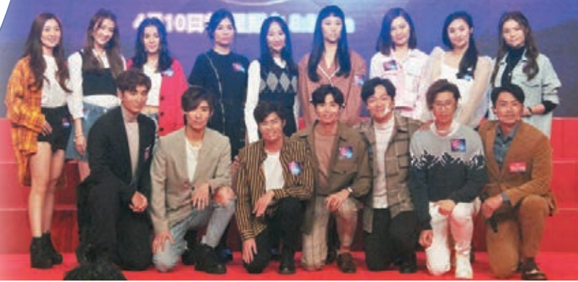
●歌唱比賽《聲夢傳奇》將在4月10日起以真人騷形式播出。

首席創意官王祖藍多番被笑言有官做才回來TVB，他推說自己不是第一個做官，「秋官」鄭