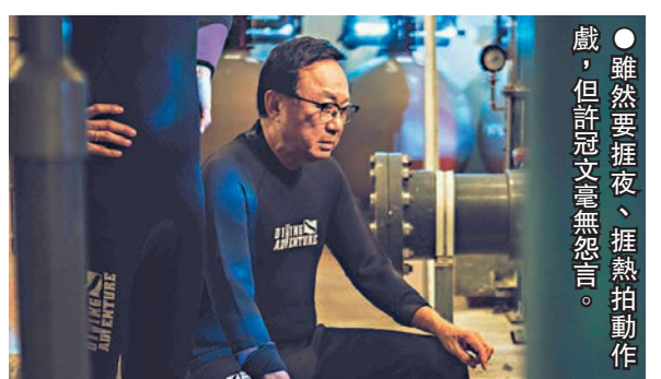
●雖然要捱夜、捱熱拍動作戲，但許冠文毫無怨言。