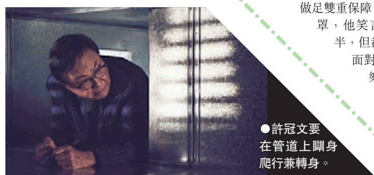
●許冠文要在管道上翻身爬行兼轉身。