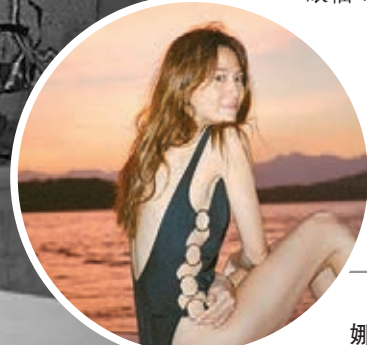
●去年見周秀娜瘦到皮包骨。