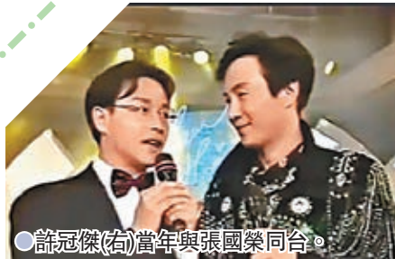
●許冠傑(右)當年與張國榮同台。