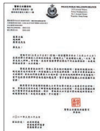
警察facebook專頁昨日將致函《蘋果日報》的信件原文刊出，以正視聽。警察fb

不過，《蘋果日報》昨日在A4版相關報道中，選擇性引述警方信件內容，再次誣毀警方拒絕安排被捕者與律師及家屬會面。警方遂於警察facebook專頁將前日致《蘋果》的信函原文刊出，以正視聽，並重申尊重被捕者的權利，及按照被捕者的意願作出安排。