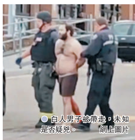
● 白人男子被帶走，未知是否疑兇。網上圖片