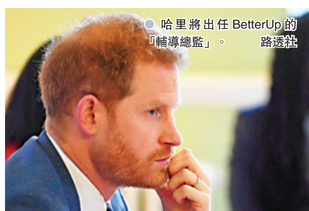
● 哈里將出任BetterUp的「輔導總監」。