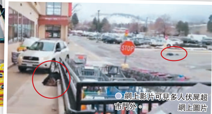
● 網上影片可見多人伏屍超市門外。網上圖片