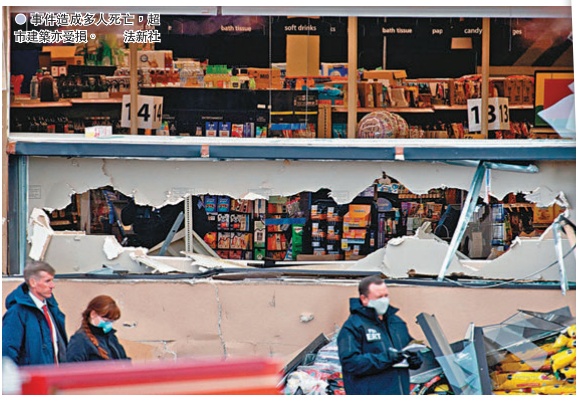
● 事件造成多人死亡，超市建築亦受損。