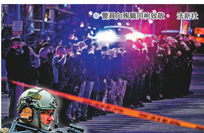
● 警員向殉職同袍致敬。