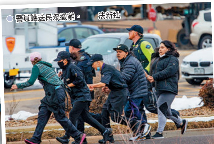
● 警員護送民眾撤離。