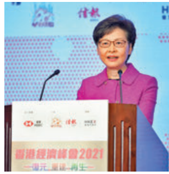
▲林鄭月娥昨日於「香港經濟峰會2021」上致辭。

談到香港未來的發展，林鄭月娥認為，只要本港掌握在「十四五」規劃中八大範疇的無限機遇，就會生機勃勃。她期望港人繼續保持對香港的信心，並支持完善選舉制度，令香港政治體制回復安全。