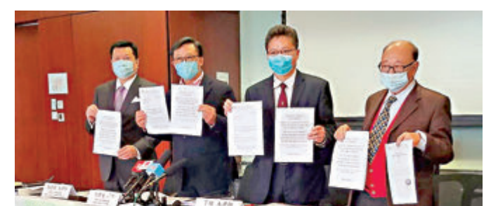
●何君堯(左二)將去信聯合國反駁世界人權報告。

何君堯昨日在記者會上指，「人權觀察」公布的世界人權報告關於香港部分，主要圍繞着2019年黑暴事件。何君堯批評相關內容完全與實際情況不符，自己親身經歷「黑