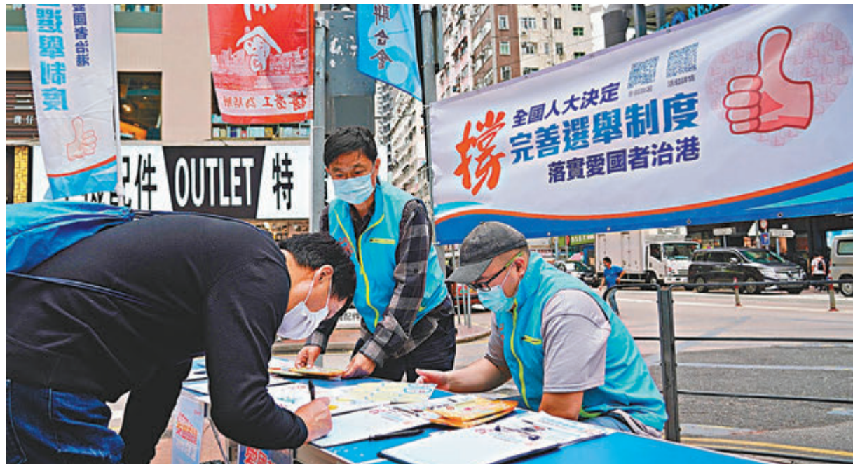
●林鄭月娥表示，完善選舉制度能堵塞香港現時的漏洞，以確保政治安全。圖為市民日前在灣仔街頭一個街站簽名，支持完善香港選舉制度。