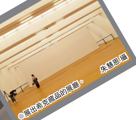
●展出希克藏品的展廳。