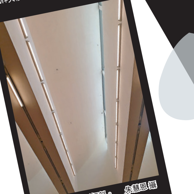
●展廳內的天花板傾斜。