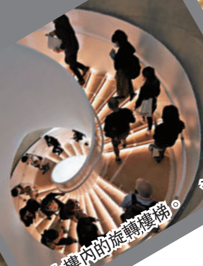
●大樓內的旋轉樓梯。