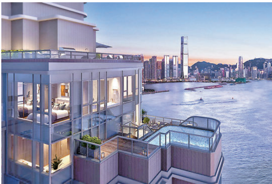
● 維港滙1第 1 座 27及 28 樓 A 室複式戶連私人泳池單位效果圖。

豪宅新盤持續暢旺，昨單日錄至少3宗逾億元成交，個別成交價更錄破頂價。會德豐地產、信置、嘉華、世茂及爪哇合作發展的西南九龍荔盈街維港滙1昨日以發價單形式推售 93 伙及首推 33 伙招標，當中以招標方式售出 4 伙，包括第 1 座頂層複式戶「天池屋」落實以逾 1.178 億元售出，呎價達 53,850 元，貴絕西南九龍以至長沙灣區住宅。買家為內地客，以海外註冊公司名義購入，須付 30% 辣稅即 3,536 萬元，足以購入 5 個維港滙1開放式單位。