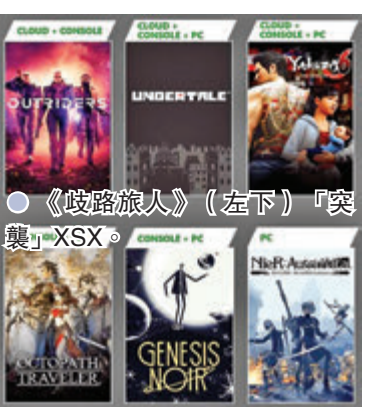
●《歧路旅人》(左下)「突襲」XSX。

款遊戲會登陸Xbox Game Pass (XGP)。 此外，Square Enix的Switch口碑作《歧路旅人》與跨平台射擊遊戲《Outriders》突然公布成為XGP其中一員，訂閱用戶當然會欣然接受。