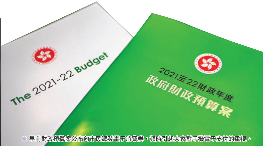
●早前財政預算案公布向市民派發電子消費券，頓時引起大家對手機電子支付的重視。