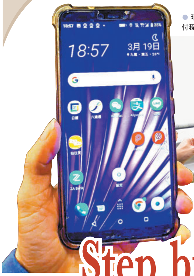
●現在，市民可以下載登記多種電子支付程式，以因應不同優惠時使用。