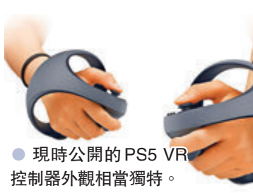
●現時公開的PS5 VR控制器外觀相當獨特。

PS陣營不停出招，以制衡Xbox和Switch的強勁勢頭。先有SIE披露對應PS5的次世代VR系統控制器，和PS4的棒狀PS Move不同，這個猶像拳套的全新控制器握在手中時跟拿着DualShock 4的手感相似，加上備有PS5手掣獨家功能「自適應扳機」和「觸覺回饋」等，帶來前所未有體驗。 日前PS亦發表包括PS5版《最