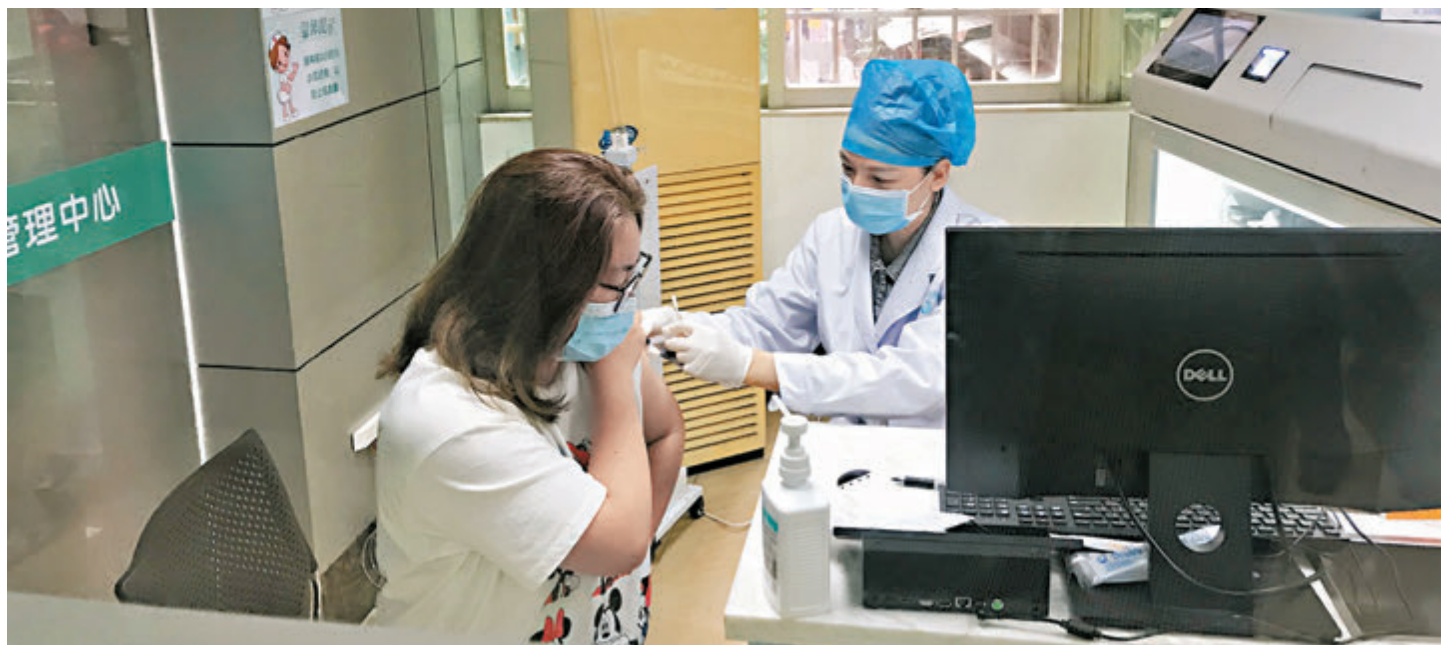
●廣州將在未來3個月內為超過1,000萬人接種疫苗。圖為廣州市民正在接種新冠疫苗。

香港文匯報記者了解到，22 日，東莞亦正式啟動大規模疫苗接種工作，同日，汕頭亦宣布從 4 月起，全市啟動大規模接種工作。和廣州增城一樣，東莞、汕頭均不限戶籍，在當地的中國籍公民（港澳台除外）都可免費接種。 黃飛當天表示，接種疫苗是新冠疫情防控的最有效的手段，疫苗接種率達到一定