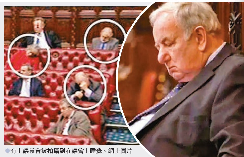
●有上議員曾被拍攝到在會議上睡覺。

英國的世襲貴族以往大部分都會自動成為上議院議員，經工黨在1999年改革後，只有92個世襲貴族席位獲保留。扣除司禮大臣與掌禮大臣這兩個涉及國會職能而保留的世襲議席外，其餘90個世襲貴族議席原本預計以自然流失方式，逐漸廢除，不過至今上議院仍然有85位世襲貴族。