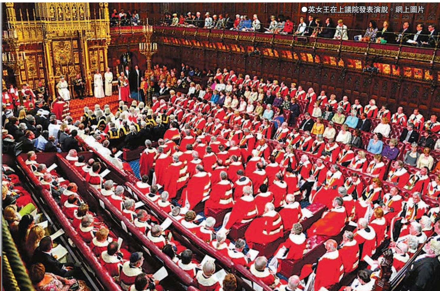
●英女王在上議院發表演說。