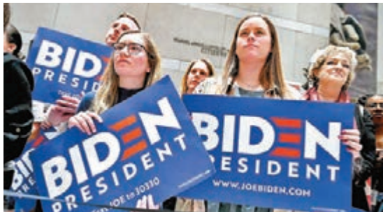
●美國近期掀起「選舉改革」熱潮，圖為去年大選的拜登支持者。

無論哪一國，法律存在目的都是維護應有秩序，使政治制度可順利運作，保障百姓利益，但制度難以完美，只能隨時推移、順應現實所需來改革，英美兩國正好示範了「唯變不變」，一成不變才是最愚蠢的做法。