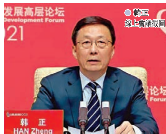
韓正出席中國發展高層論壇2021年會線上會議截圖。韓正表示，中國將着力優化能源結構，控制化石能源總量，提高非化石能源在一次能源消費中的比重，2030年這一比重將達到25%左右；着力優化調整產業結構，嚴控高耗能行業的產能規模，深化能源和相關領域的改革，加快推進碳排放權的交易，鼓勵各方積極開展低碳技術的創新，引導形成綠色低碳的生產生活方式，着力提升生態碳匯能力，2030年森林蓄積量將比2005年增加60億立方米。

韓正重申，中國構建新發展格局不是封閉的國內循環，而是更加開放的國內國際雙循環。中國開放的大門不會關閉，只會越開越大。繼續同各國加強宏觀政策的協調，攜手應對新冠肺炎疫情的衝擊影響，世界經濟復甦基礎不穩固，中國願同各國加強協調，實施有力有效的財政金融政