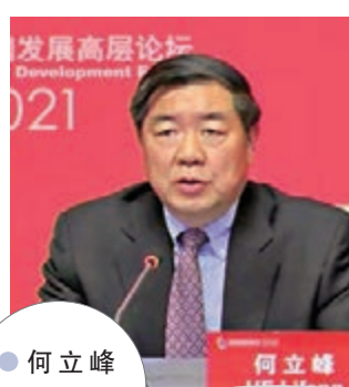
何立峰出席中國發展高層論壇2021年會線上會議截圖。

香港文匯報訊（記者 海巖 北京報導）國家發改委主任何立峰21日晚間出席「中國發展高層論壇2021年會」，解讀「十四五」時期中國宏觀政策取向。何立峰表示，保持經濟持續健康發展，鞏固經濟恢復性增長的基礎，是當前世界各國都在面臨的緊迫任務。今年宏觀政策將繼續為市場主體紓困，保持必要的支持力度，根據形勢變化適時調整完善，進一步鞏固經濟基本盤。另外，何立峰指出，「十四五」要促進國內國際雙循環，協同推進強大國內市場和貿易強國的建設，持續增強中國經濟對全球要素資源的吸引力和合作能力。