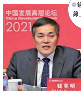
錢克明出席中國發展高層論壇2021年會線上會議截圖。