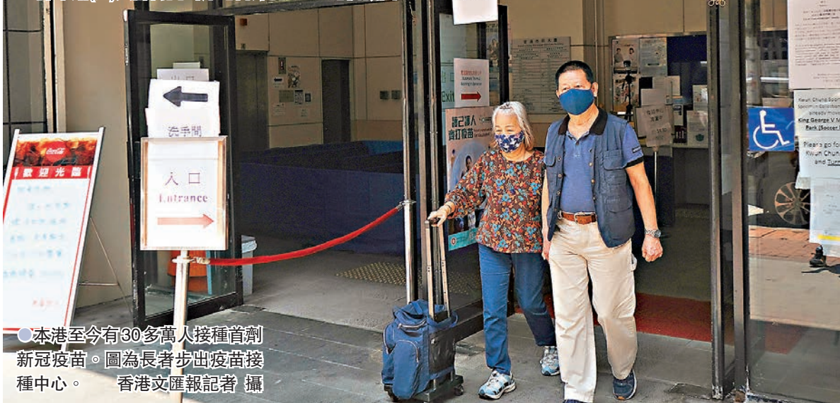
●本港至今有30多萬人接種首劑新冠疫苗。圖為長者步出疫苗接種中心。