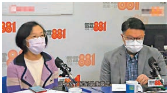
▲陳肇始(左)與許樹昌出席電台節目

衛生防護中心總監林文健昨日在網上研討會表示，香港過去一年經歷了四波疫情，惟現時第四波疫情未完全撲熄，而下一步會加強緊密接觸者和其他接觸者的追蹤工作，希望在個案回落時加大力度進行追蹤，有助達至個案「清零」，加上疫苗接種造成群體免疫，也會以科技協助包括個案追蹤系統、檢測電子化等，並會對變異病毒嚴陣以待。