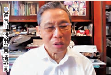
●鍾南山在研討會直播截圖

鍾南山說，內地真正非常願意接種疫苗的市民仍不算很多，現時接種率約為4%，「因為他們覺得必要性不大，廣州一外出就戴口罩，覺得現時沒什麼事、幾好。」但這只靠