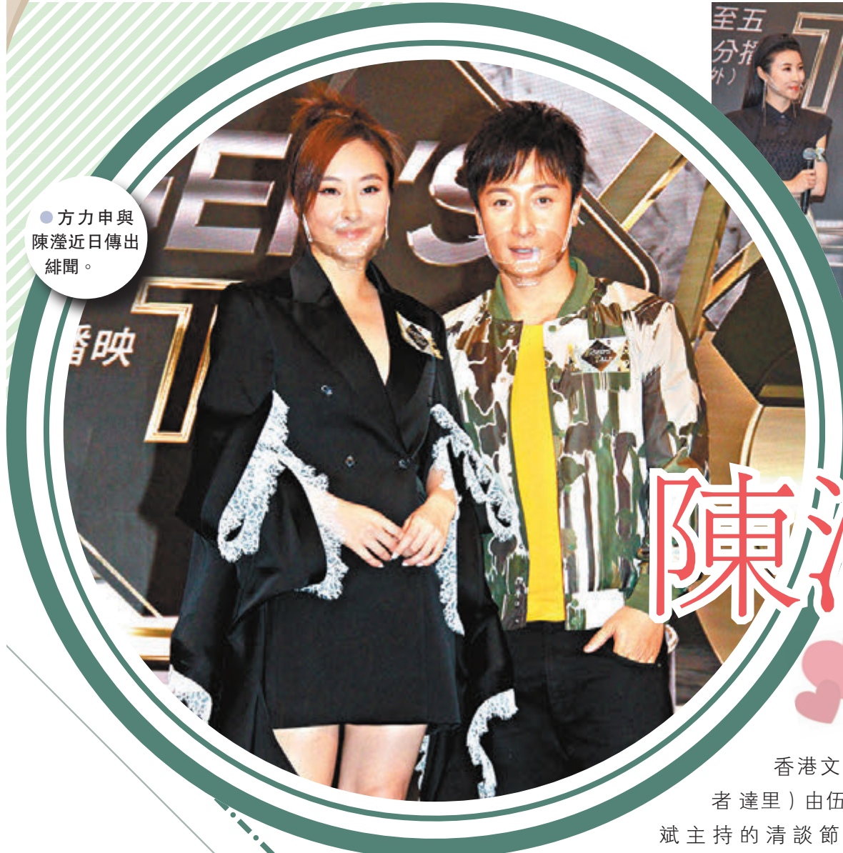
● 方力申與陳滢近日傳出緋聞。