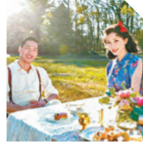
● AKIRA(左)向太太提供意見及靈感。