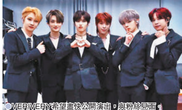
● VERIVERY希望盡快公開演出，與粉絲見面。