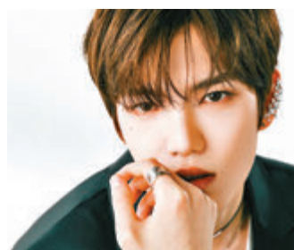
● 啓賢透露他們計劃以後在休假期間學習中文。