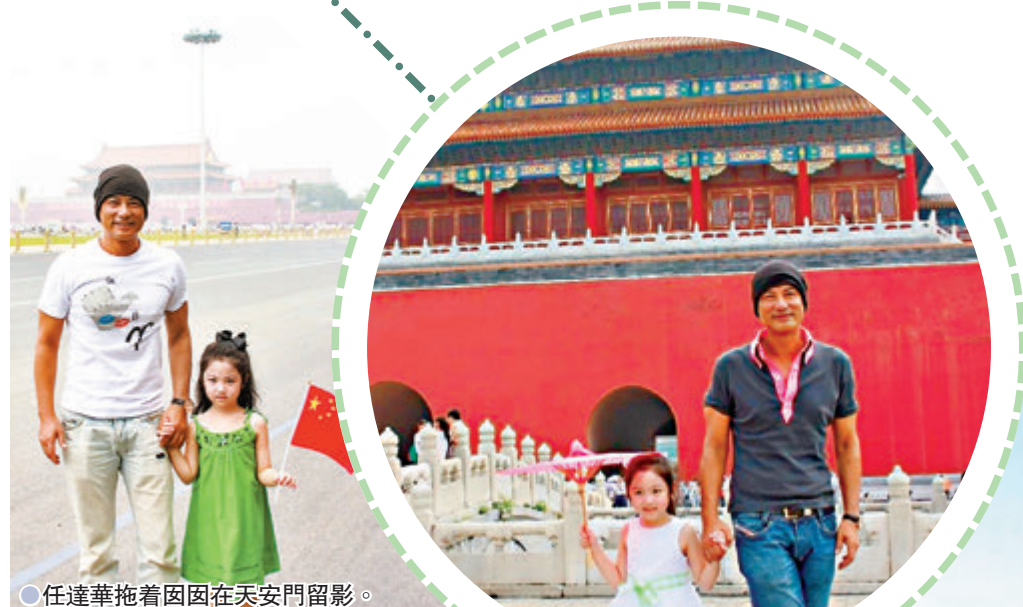
● 任達華拖著囡囡在天安門留影。