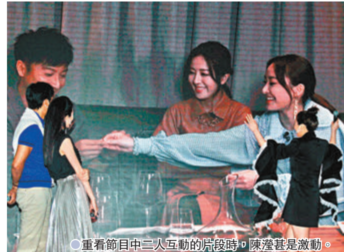
● 重看節目中二人互動的片段時，陳滢甚是激動。