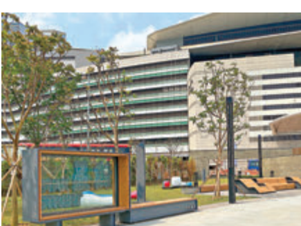
●新開放的用地內的林蔭草坪、大量不同設計的桌椅，和介紹海岸線變遷的霓虹燈裝飾。