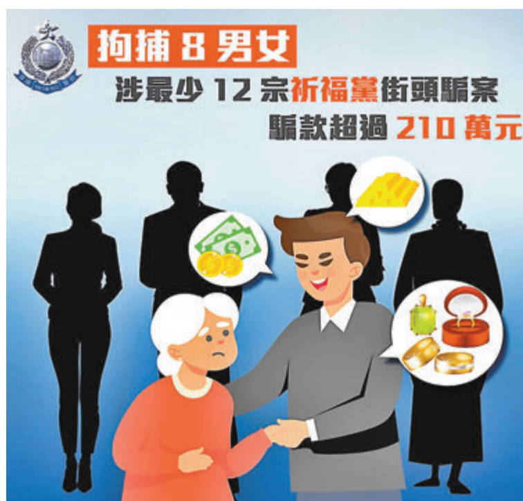
●警方facebook同步交代偵破祈福黨詐騙集團案件詳情。香港警察fb截圖

警方呼籲市民多加提醒身邊的長者保持警覺，在街上切勿輕信陌生人將個人資料告知別人，包括家庭狀況所擁有的財產，亦不應將財物交予陌生人。遇有懷疑，市民可致電「防騙易」熱線18222，或報警求助。