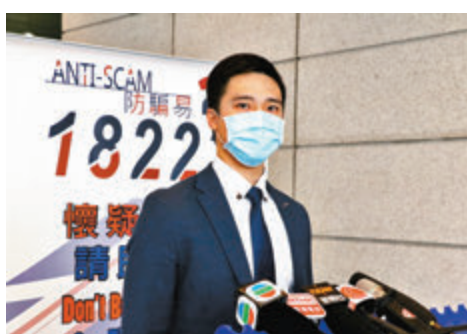
●張文瀚高級督察昨日講述警方偵破一個最少已騙取11名老婦共210萬港元財物的祈福黨詐騙集團。

當受害人將財物交予騙徒祈福後，騙徒會迅速偷龍轉鳳，以另一個一模一樣的袋交還給受害人，並叮囑她在一周後才打開，祈福才靈驗，最後事主發現財物盡失。