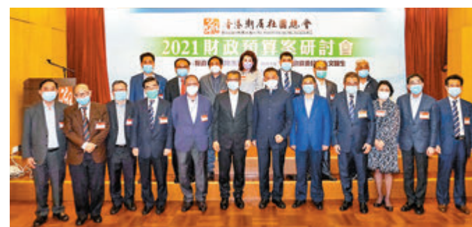
●香港潮屬社團總會舉辦財政預算案研討會，賓主合影。

香港文匯報訊(記者 子京)財政司司長陳茂波日前參加香港潮屬社團總會財政預算案研討會，他表示，五月開始推出的五千元電子消費券，可直接令市民感受到特區政府的關懷和幫助，同時也減輕商界目前碰到的營商困境。