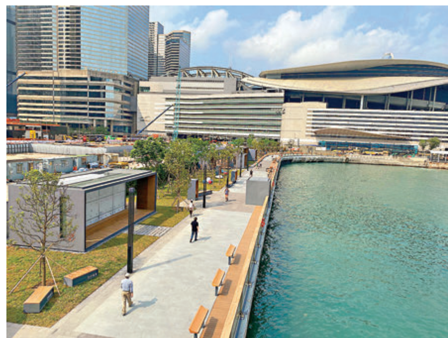
●灣仔碼頭海濱的「渡輪碼頭畔主題區」昨日起進一步開放，為市民提供更多消閒海濱空間。

發展局發言人說：「我們會繼續於灣仔海濱的基建工程仍在進行期間，逐步開放更多海濱空間。預計到今年底至明年年初，灣仔海濱新落成的休憩用地將達45,000平方米。屆時會更有更多的設施供不同興趣和年齡層的市民享用，並能營造更多的機會讓各界參與海濱建設，提升社區對海濱的歸屬感。」