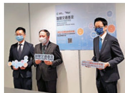
●運輸署公布，10億元智慧交通基金本月底起接受申請。

香港文匯報訊(記者 唐文)10億元智慧交通基金將於本月31日起接受申請。基金用於資助本地機構或企業進行交通方面的創新科技研究和應用，以便利市民出行、提升道路網絡或路面使用效率和改善駕駛安全。研究和應用項目的資助金額上限為2,000萬元，純研究項目則最高可獲800萬元資助。申請項目須有50%的研究活動在本港進行，最快3個月可完成審批。