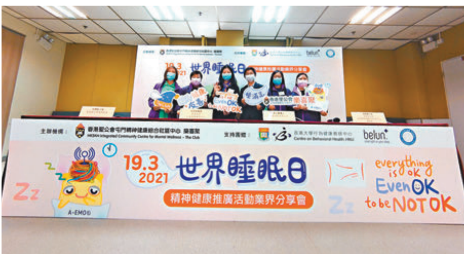
●香港聖公會福利協會一項問卷調查發現，四成受訪者在疫情期間的睡眠質素和精神健康變差，該會自創「愛笑抗疫運動」後，初步發現對改善睡眠質素和精神健康有正面效果。

為了關注上述情況，香港聖公會屯門精神健康綜合社區中心去年10月至12月舉辦了「愛笑抗疫兩點半」運動，以「愛笑瑜伽」作為藍本，讓員工每周三次在下午2時半笑足30分鐘，並提出「抹窗哈哈笑」、「拖地笑呵呵」、「抹枱笑騎騎」、「洗手笑咪咪」、「狂笑戴口罩」五招讓員工花式展現笑容。中心早前評估活動成效，初步發現參加者的睡眠質素、環境適應力提升，抑鬱等負面情緒遞減。