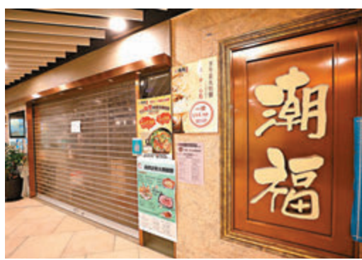
▲位於啓田商場的潮福龍蝦專門店因食客染疫需暫停營業。