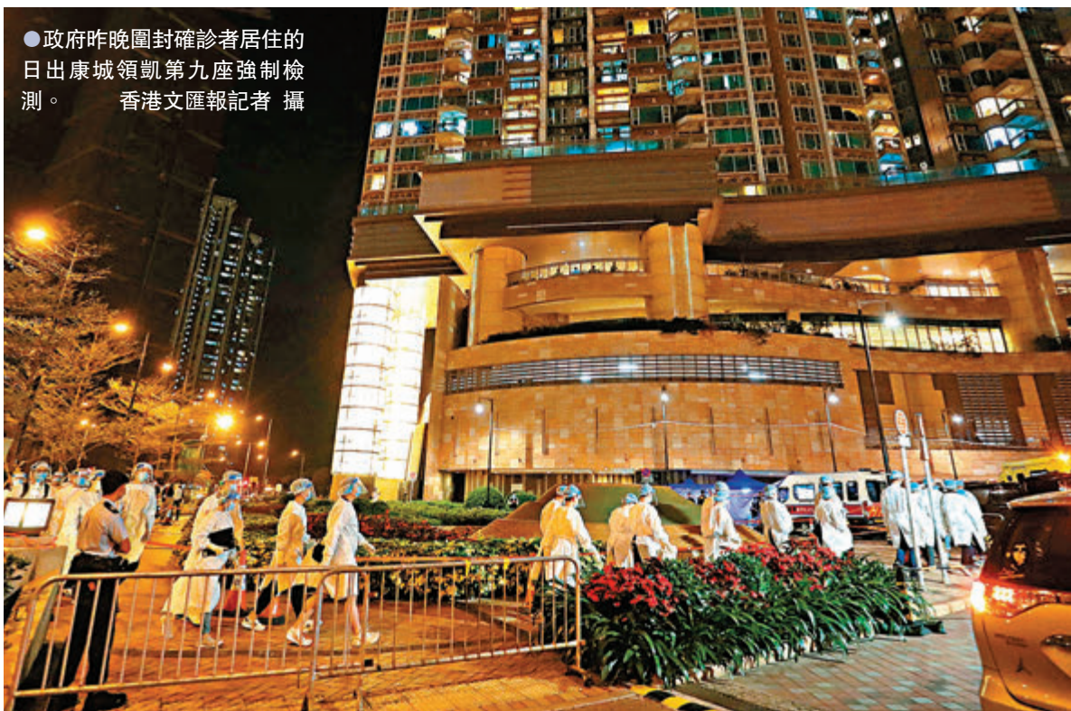
●政府昨晚圍封確診者居住的日出康城領凱九座強制檢測。