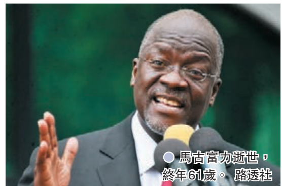
●馬古富力逝世，終年61歲。

不過篤信天主教的他自2月底起未有再次公開露面，更連續3個星期沒有到教堂禮拜，令外界懷疑他可能染疫。