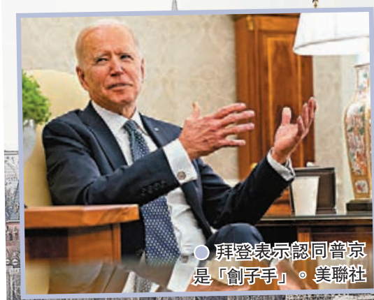
●拜登表示認同普京是「劊子手」。