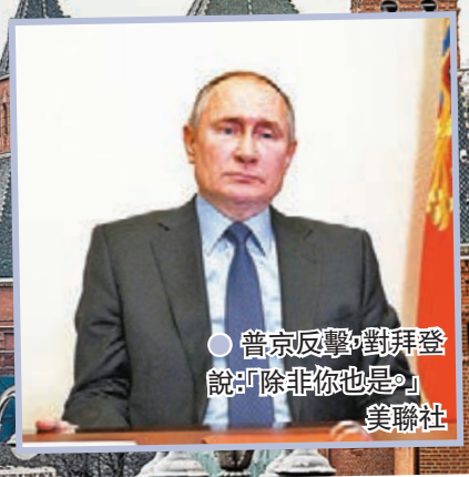
●普京反擊對拜登說：「除非你也是」。美聯社