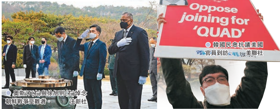
●韓國民眾抗議美國官員到訪。