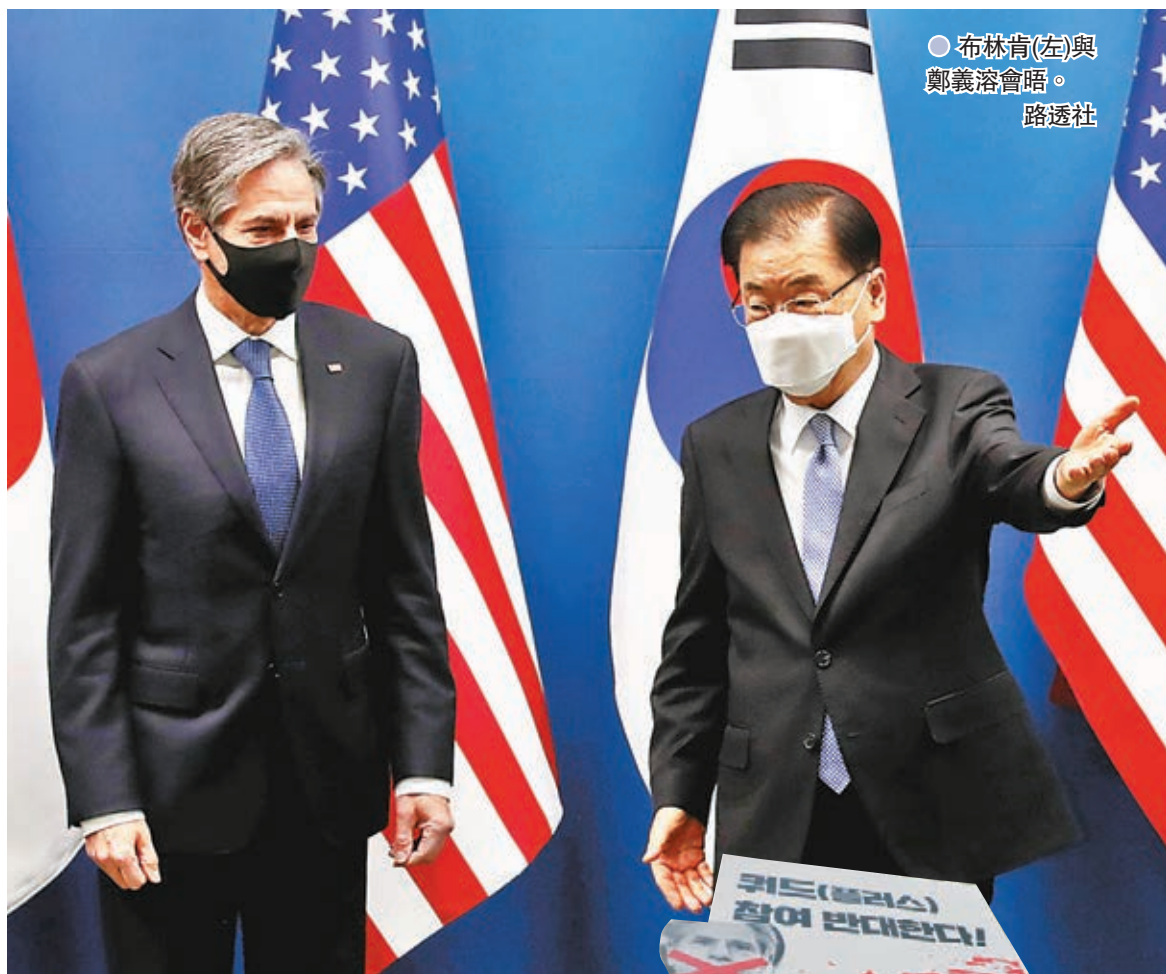
●布林肯(左)與鄭義溶會晤。