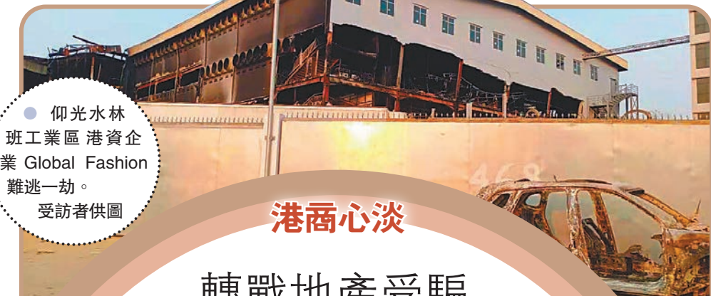
● 仰光水林班工業區港資企業Global Fashion難逃一劫。