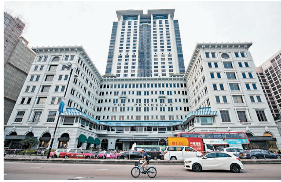
●經營香港半島酒店的大酒店昨公布去年盈轉虧，全年蝕19.4億元。截至去年底，集團共有5,609名全職員工，明顯低於2019年的7,451名。資料圖片

另一方面，集團正於緬甸發展仰光半島酒店項目。緬甸近期的政局變化，導致軍方於2021年2月1日宣布該國進入為期一年的緊急狀態。因此，集團深切關注最近發生的暴力和動亂情況，並會考慮需要採取的即時行動，和繼續評估此項目有關的