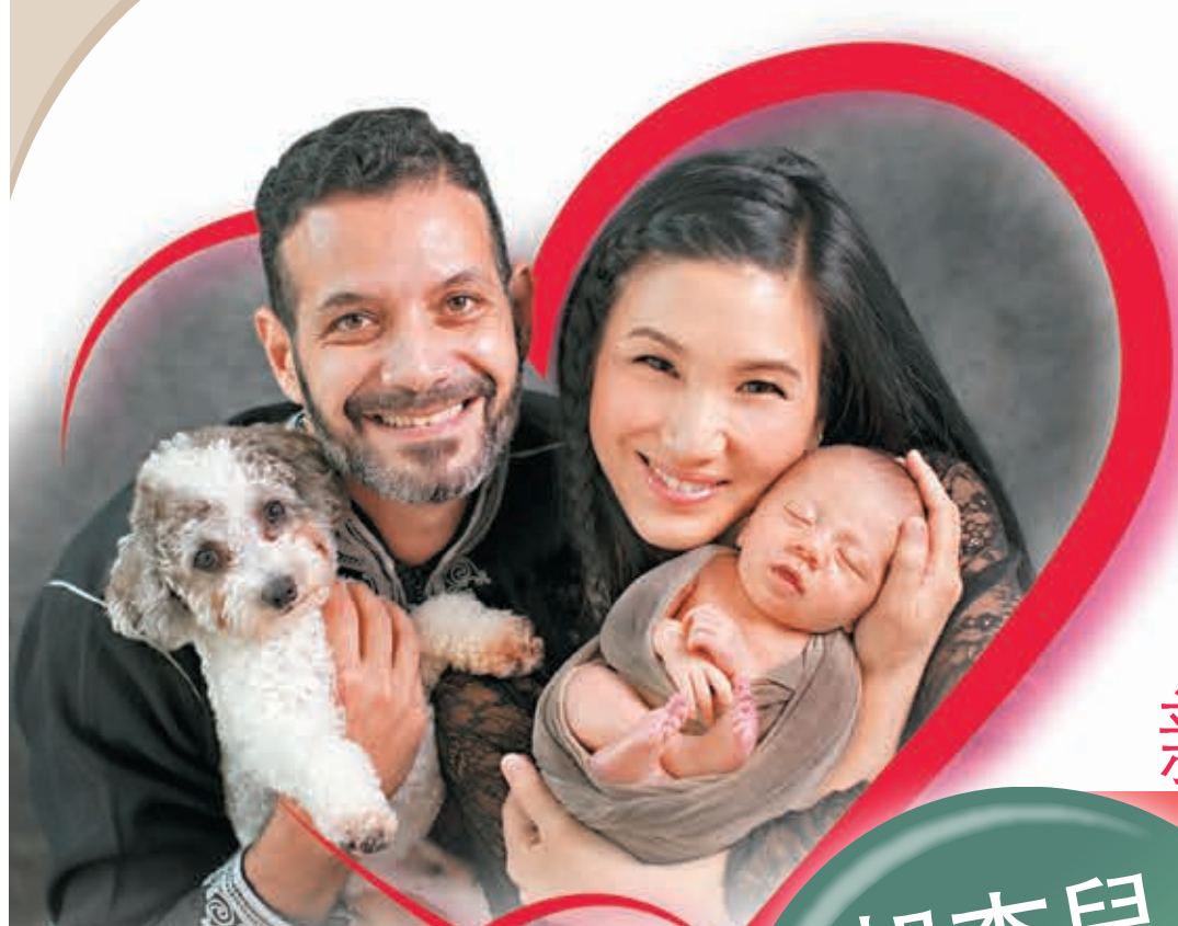
●原子鏽借丈夫、團圓及愛犬影全家福。