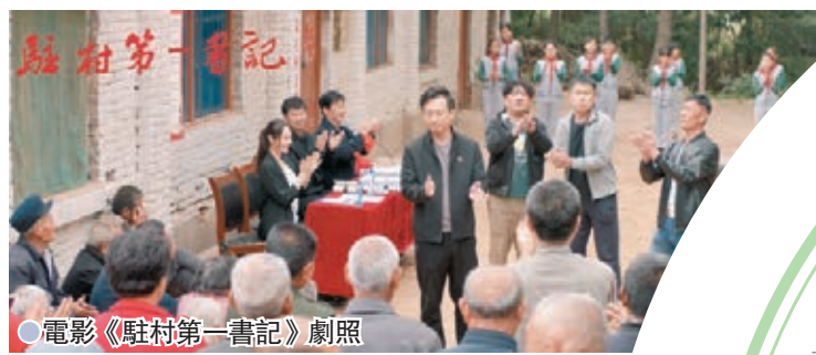
●電影《駐村第一書記》劇照