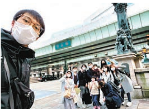
●吳業坤「衝線」一刻,有粉絲守候。