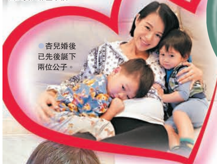
●杏兒婚後已先後誕下兩位公子。