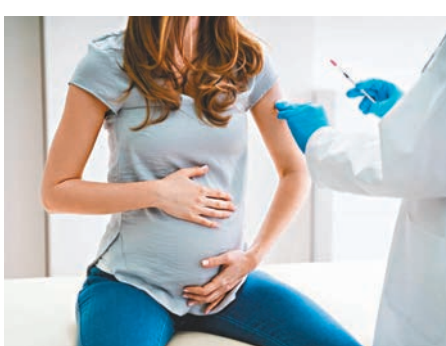
●全球出現首宗孕婦打針後將抗體傳給新生兒的個案。