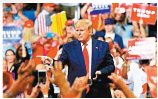
●俄方被指企圖協助前總統特朗普勝選。