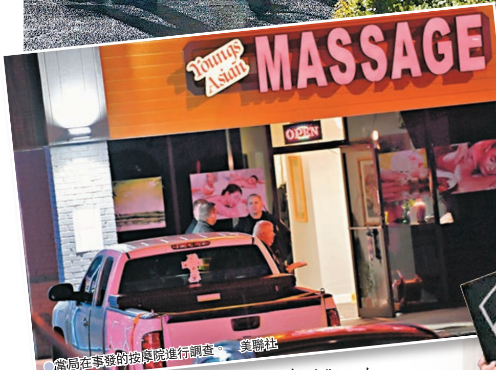
●當局在事發的按摩院進行調查。