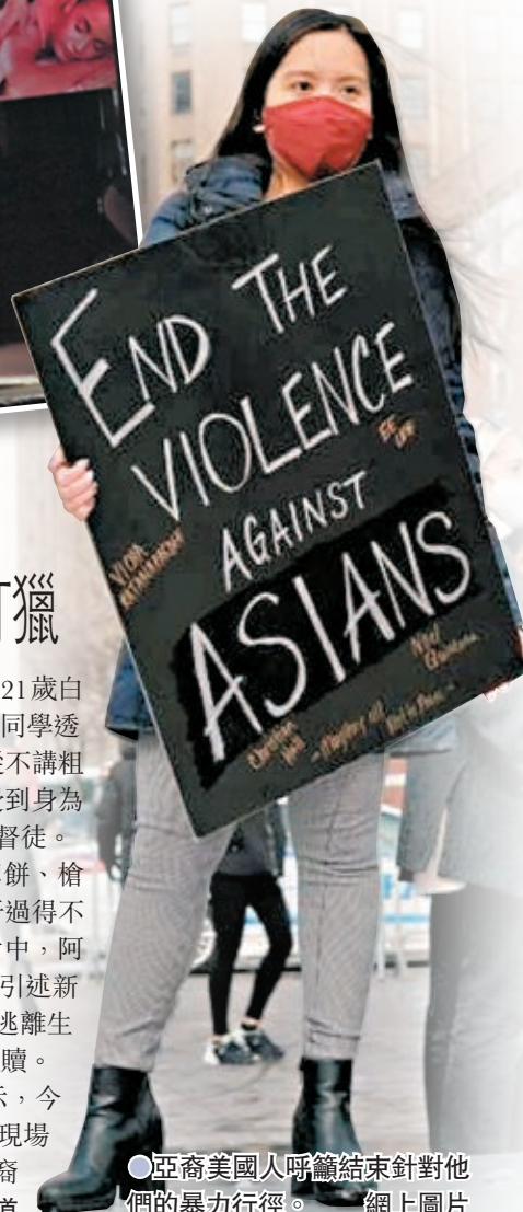
●亞裔美國人呼籲結束針對他們的暴力行徑。