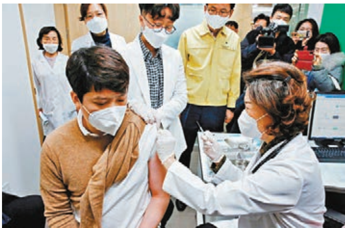
●韓國一名醫護接種阿斯利康疫苗。