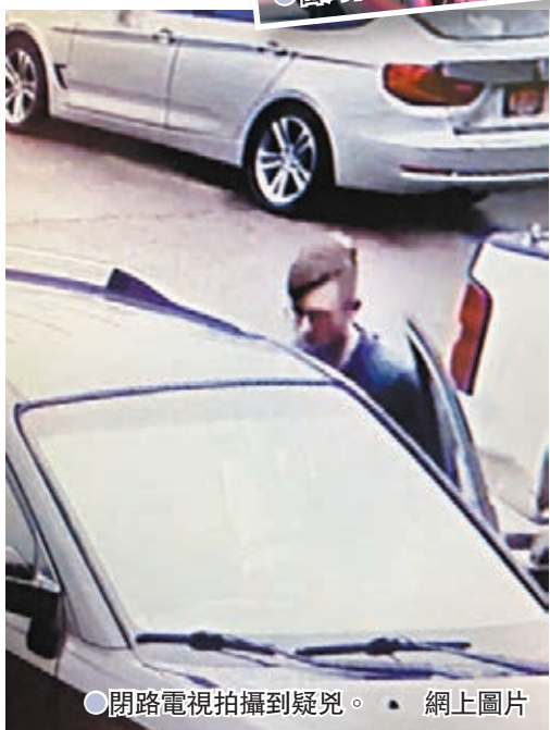
●閉路電視拍攝到疑兇。