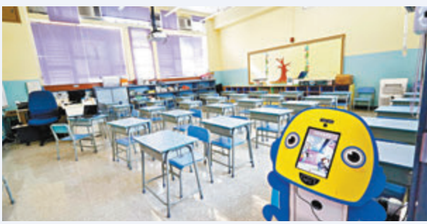
● 找了課室「周圍」，那課室裡面呢？ 資料圖片

粵語的「周圍」有兩個意思，一個等於普通話的「周圍」，一個等於普通話的「到處」，香港同學說普通話的時候要注意分清。有關位置的詞彙，粵語和普通話有差別的，例如粵語的「開面」、「出面」和「埋面」、「入面」，分別等於普通話的「外邊兒」和「裡邊兒」。但有時又有「靠外邊兒」和「靠裡邊兒」的意思，這時候的「靠」字是不可以省略的。比方說「本書放響櫃筒開面」，普通話就要說成「那本書放在抽屜靠外邊兒。」如果你省略了「靠」字，就變成了本書不是放在抽屜裡，而是抽屜外