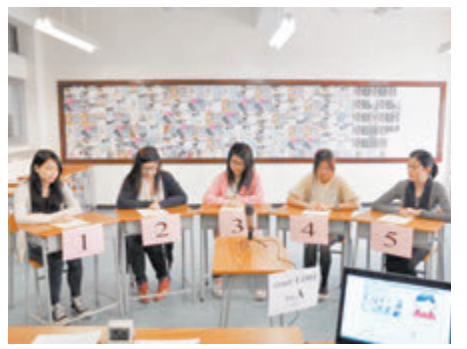
● 中文科將刪去口語溝通卷。 資料圖片

高中普通話科曾是會考的科目。新高中課程實施後，普通話不再獨立成科，而成為中文科的選修單元，用以校本評核。而公開試方面，則容許擅長普通話的學生在口語溝通卷中選擇以普通話應試。如今口語溝通一卷取消，高中公開試的普通話元素也將全面告別歷史舞台，對普通話教育而言更為不利。 對於刪去聆聽及綜合卷、校本評核刪去選修單元及閱讀記錄的異議不大，加強中國文學和文言經典學習內容的用心也應是良好的。不過，經此修訂，中文科真的能省出50小時分給其他學科嗎？還是以往的課時嚴重不足，如今只是令以前超耗的現象稍有改善？ 最重要一點，是我們應該讓學生學些什