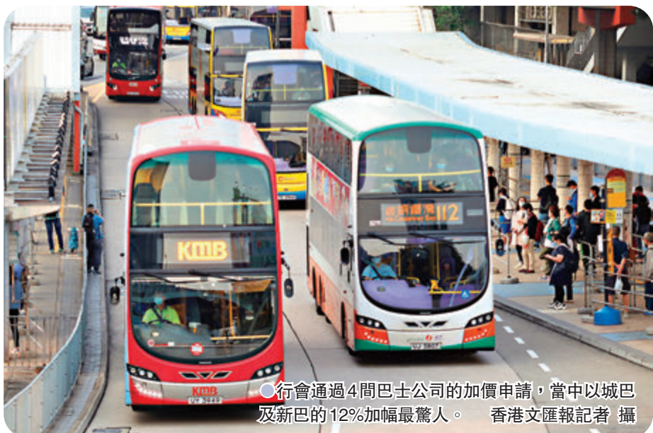
行會通過4間巴士公司的加價申請，當中以城巴及新巴的12%加幅最驚人。

受新冠肺炎疫情影響，香港特區經濟低迷，基層市民昨日噩耗連連，最新公布的失業率攀至17年以來的新高（見另稿）。但就在此嚴峻形勢下，行政長官會同行政會議卻通過4間巴士公司的加價申請，當中以城巴及新巴的12%加幅最驚人，將分階段於下月及明年1月實行，九巴及新大嶼山巴士則分別獲批准加價8.5%及9.8%。首階段新車費實施後，約90%乘客每程多付不逾1元，但多條過海的新巴路線在第二階段加價後，乘客要多付逾1元。新大嶼山巴士3條昂坪路線於假日的加幅更高達15%。有學者及立法會議員均認為，逆市加價，勢必加重市民的財政負擔，建議政府增加對市民交通費用的補助。