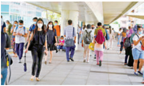
●現代化的天橋取代傳統的街巷，成為社區聯繫的渠道。

另一方面，隨著居民作為商品消費者的屬性日益增強，社區文化聯結卻削弱了。穿梭在跨街天橋上，居民很難分清地面上的街道，更談不上什麼特別的街道體驗。人與社區的關係，通常表現為充滿市井味的街道作用於人的感官而形成的一種特殊體驗。不同街道給人帶來不同觀感，源於街坊對特定街道生活的感知和記憶。這種生動的街區文化和民生氣息，被天橋的效率性和功利性蠶食。當你在便捷的天橋系統中行或購物，靜下心來漫步的可能性是不大的，同時會忽略街面上的特色小店。文化積澱的過程沒有了，結果也就沒有了。香港社會自世紀六、七十年代以來逐漸形成的家園意識和共同體意識，進入二十一世紀後有些弱化和變質，當然不是發達的天橋系統直接造成的，但不能說與其沒有一定關係。